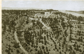
Repoblación de P. halepensis en el entorno de la Casa de Guardería Forestal. Esfiliana. Granada. 1946. L. Casado