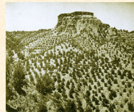
El Torreón: aspecto de la repoblación. Esfiliana. Granada. 1946.