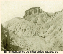
El Torreón: antes de iniciarse los trabajos de repoblación. Esfiliana. Granada. 1930. L. Casado.