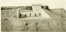
Habilitación de una cueva en Casa de Guardería Forestal. Esfiliana. Granada. 1940. L. Casado