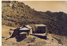
Ermita de las salinas. Maçanet de Cabrenys. 1930.