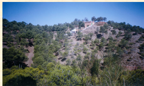
Situación en la zona en 2001. Esfiliana. Granada. Pepe Mesa.