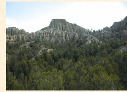
El Torreón: aspecto en 1991.