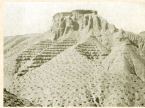
El Torreón: preparación del terreno, casillas y fajas. Esfiliana. Granada. 1932.