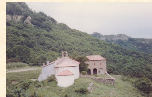
Ermita de las salinas. Maçanet de Cabrenys. 1992. José Luis Molina Vicente.

El territorio presenta una gran capacidad de cambio, lo que hoy percibimos como paisajes idílicos y armónicos pueden proceder de otros en los que la vegetación había sido destruida y la geomorfología fuertemente modificada. (Manuel Valdés y Gil 1996)