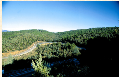
P.N. "Despeñaperros". Repoblaciones ornamentales en monte "Las Lomas". A la izquierda y al fondo, "Monte Santo". Santa Elena. Jaén. 2001. Jesús González-Cordero.