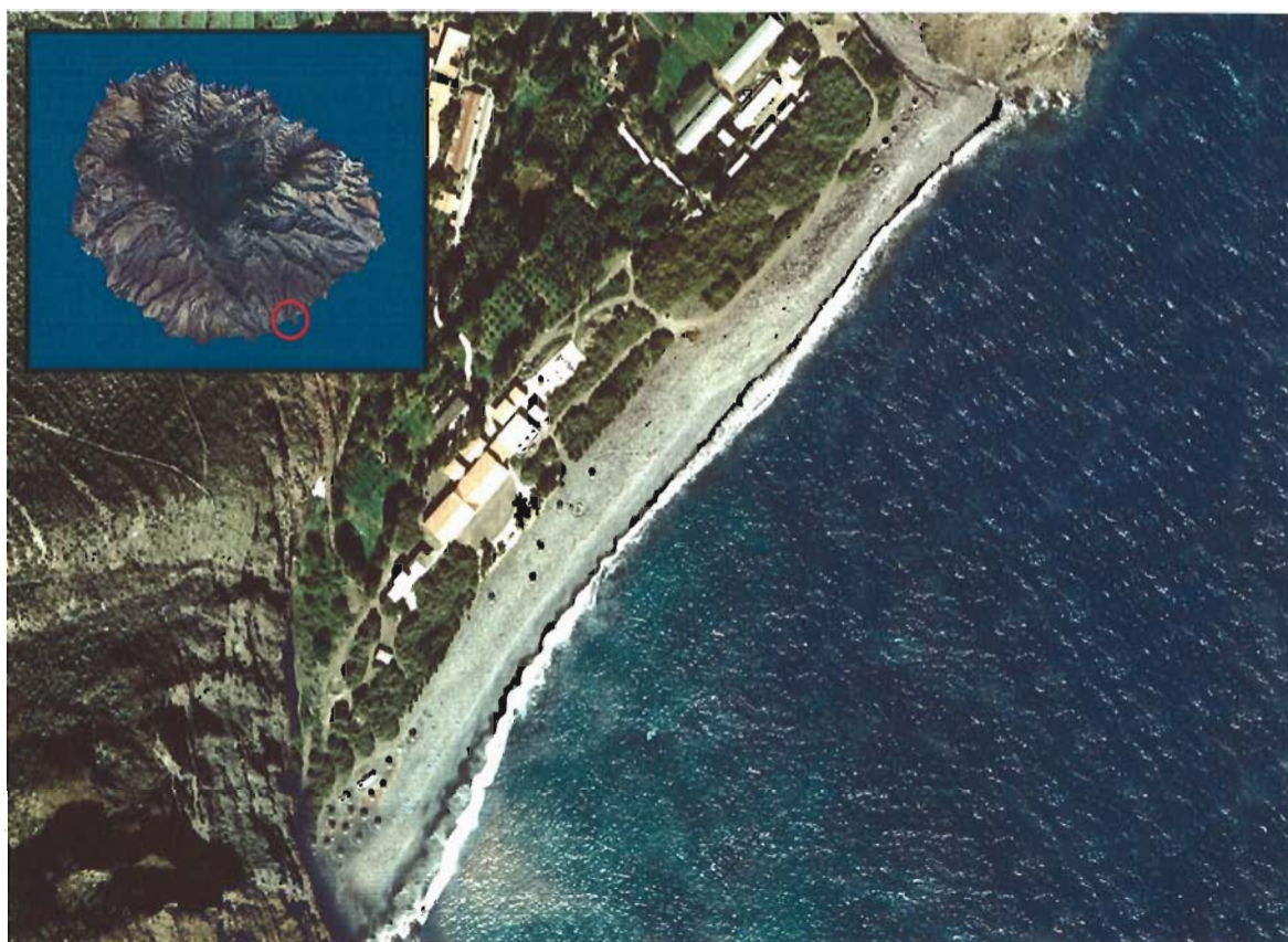
Figura 49. Playa de El Cabrito (Isla de La Gomera).