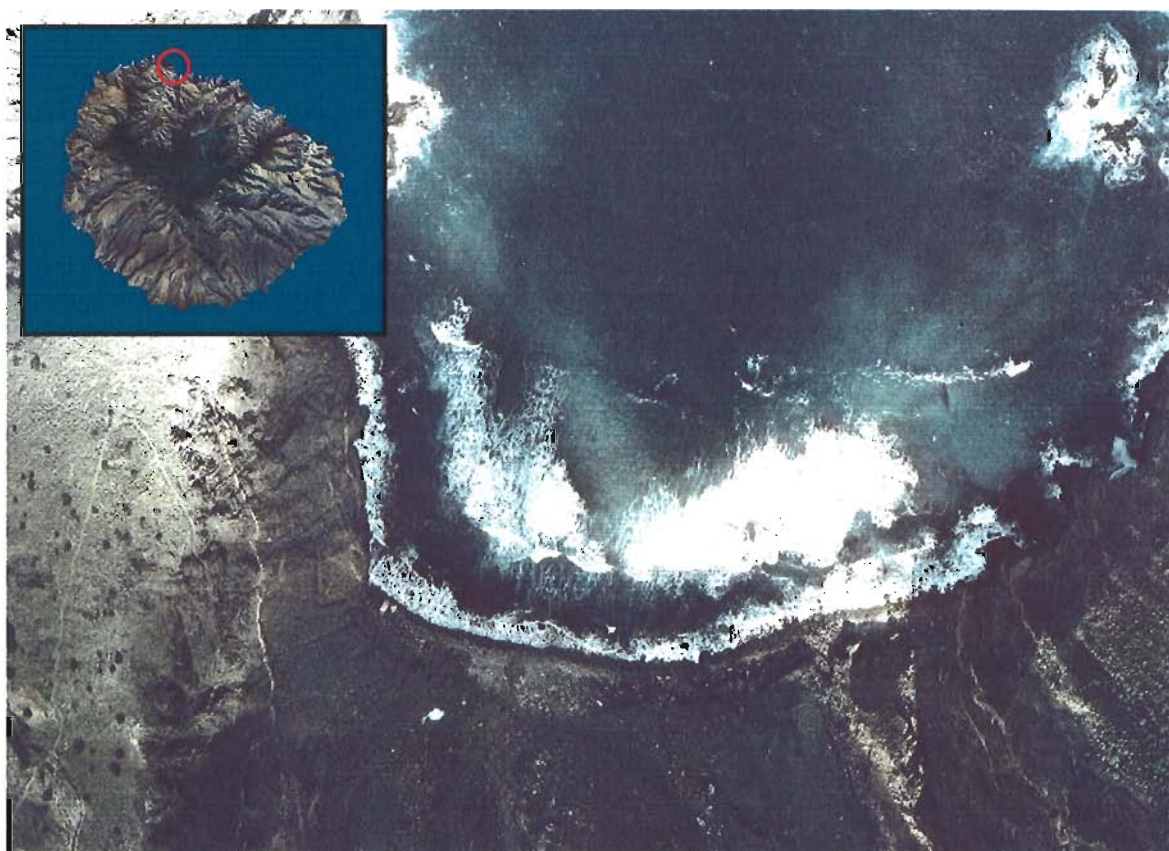
Figura 160. Playa de La Sepultura (Isla de La Gomera).