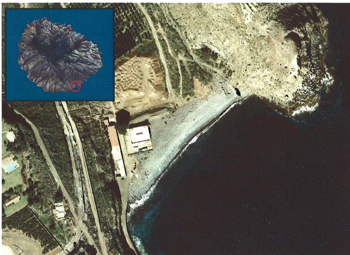
Figura 83. Playa de Tapahuga (Isla de La Gomera).