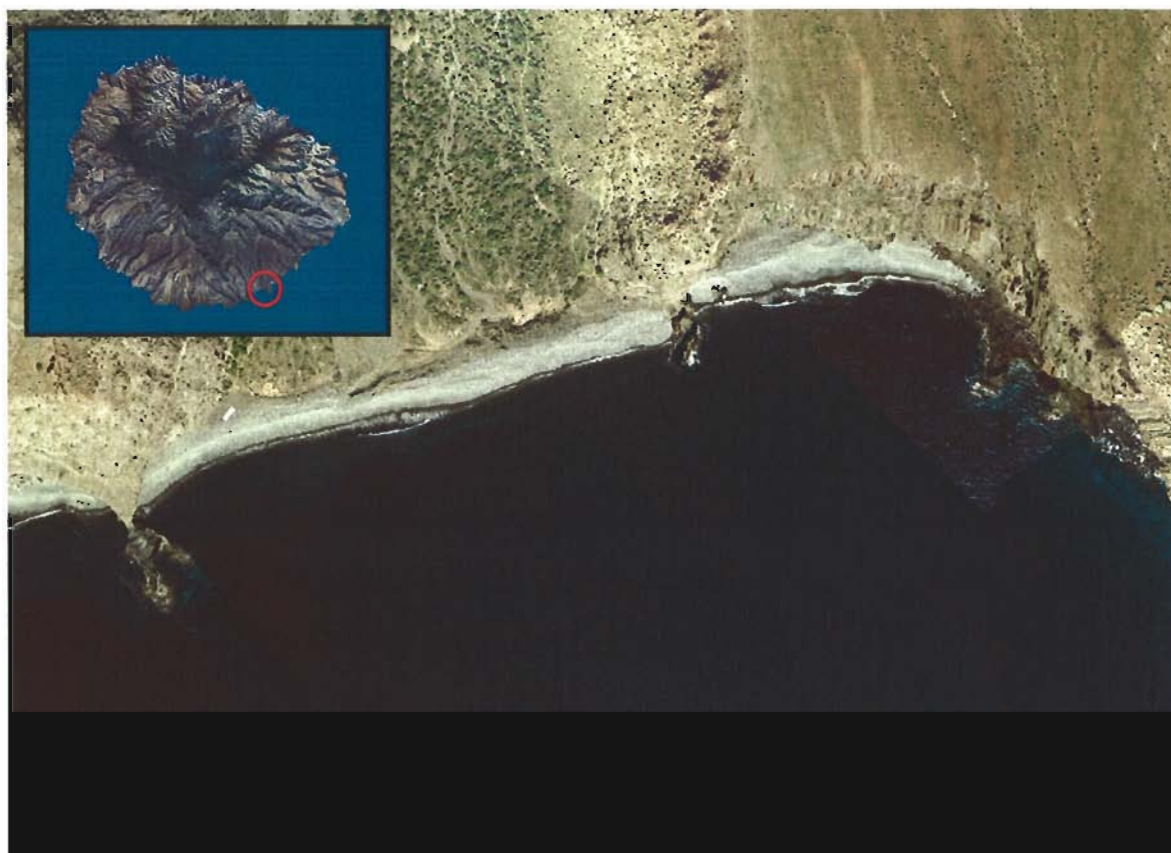
Figura 74. Playa de Chinguarime (Isla de La Gomera).