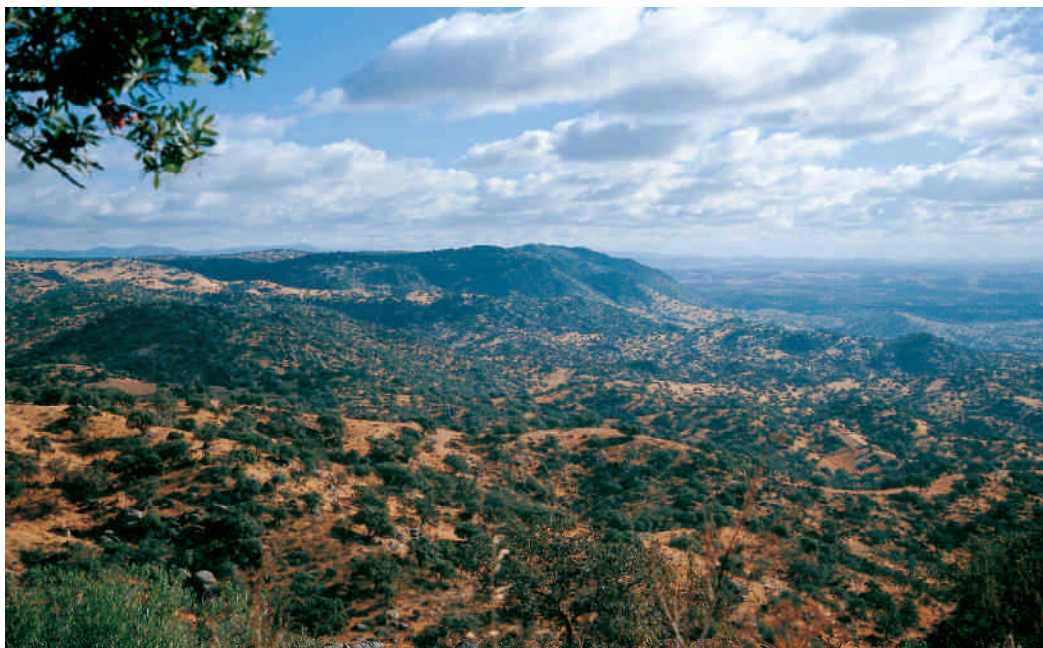
Sierras de Andújar (Sierra Morena Oriental, Jaén).

cos que vierten al río Guadalquivir. Por el oeste comprende las sierras que vierten en la margen derecha del río de las Yeguas, en los términos municipales de Cardeña y Montoro (Córdoba).