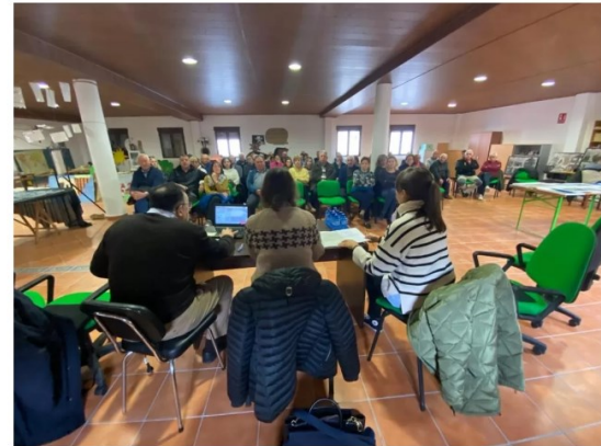
Participantes en la reunión en la que se constituyó la junta gestora del monte Sociedad del Término de Bueña

TERUEL BAJO ARAGÓN COMARCAS CULTURA DEPORTES EN LA ÚLTIMA OPINIÓN EDICIÓN EN PDF HEMEROTECA