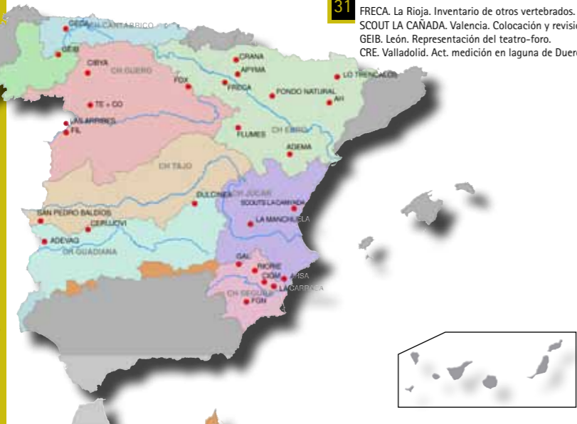
Organizaciones que actúan en varias COHEI: CRE (COH) (CA, DU, EB, JU, MS)