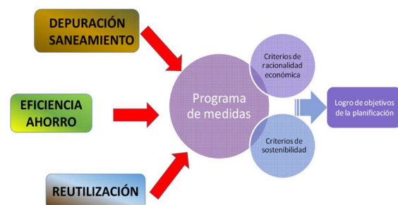
Temáticas de los programas de medidas de los planes hidrológicos, abordada a través del Plan DSEAR

El plan DSEAR se configura como un plan complementario al proceso general de planificación hidrológica. El objetivo estratégico del PLAN DSEAR es ordenar, clarificar y priorizar las medidas incluidas en los programas de medidas los planes hidrológicos de segundo ciclo (2015-2021) en las materias de depuración saneamiento, ahorro, eficiencia y reutilización, y que han de ser revisadas para configurar los programas de medidas de los planes hidrológicos de tercer ciclo.