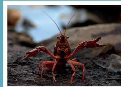
Cangrejo rojo americano