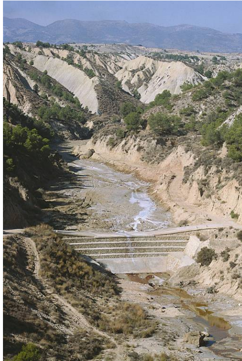
Dique de mampostería gavionada en la rambla de Librilla, afluente del Guadalentín, Murcia