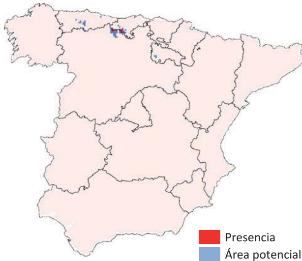
■ Presencia ■ Área potencial