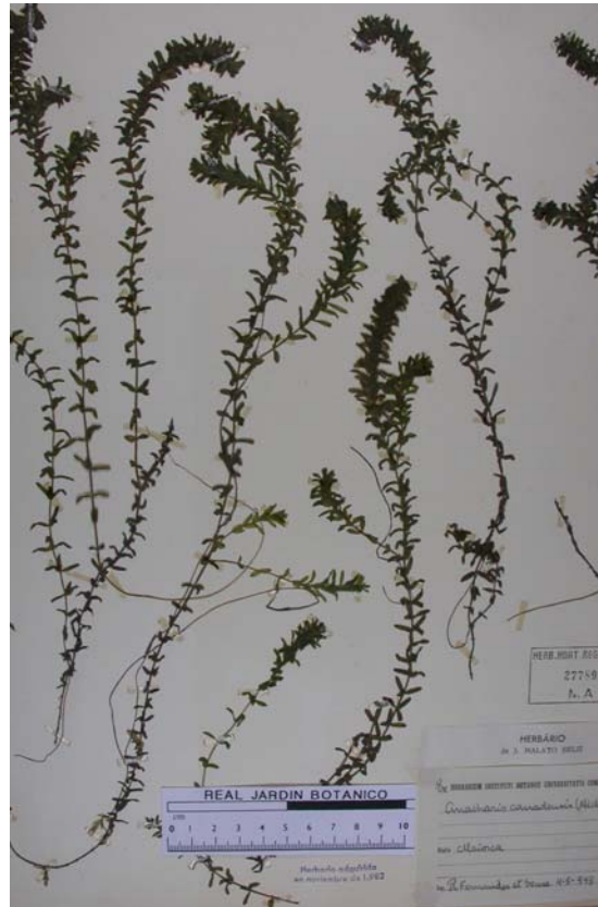
Broza del Canadá, peste de agua (cast.); elodea (cat.).