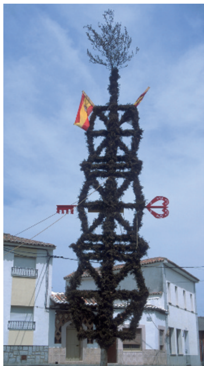
Cruz de Mayo con ramas de romero. Nuez, 16-V-2002. Javier Tardío

Junto con la palma, el laurel, el olivo y otras plantas, es uno de los ramos propios del Domingo de Ramos. Después se coloca en las fincas, ventanas o puertas de las casas como ramo protector de casa y cosechas, para impedir la entrada de brujas o para protegerse de los rayos y el granizo quemándolo en días de tormenta [57,66]. En Cataluña se adornaban las ramas de laurel, de olivo y de romero con galletas y rosarios para ir a bendecirlas el Día de Ramos. Se quemaban los días de tormenta y se rezaba la siguiente oración: Sant Marc, Santa Creu, Santa Bàrbara no ens deixeu, dels llamps i de les tempestes deslliureu-nos, Trinitat Santíssima [46,52]. La misma costumbre se encuentra en otras zonas de la Península. Como ocurre con otras especies, sus propiedades resultan óptimas si se recoge la noche mágica de San Juan [15].