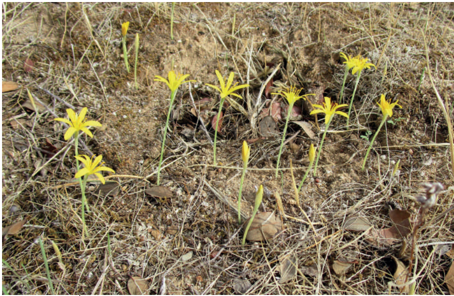
D. Draper Munt

LESPE 2015: Narcissus humilis (Cav.) Traub