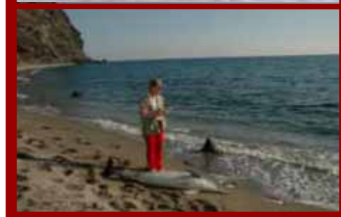
Actuaciones ambientales a nivel local