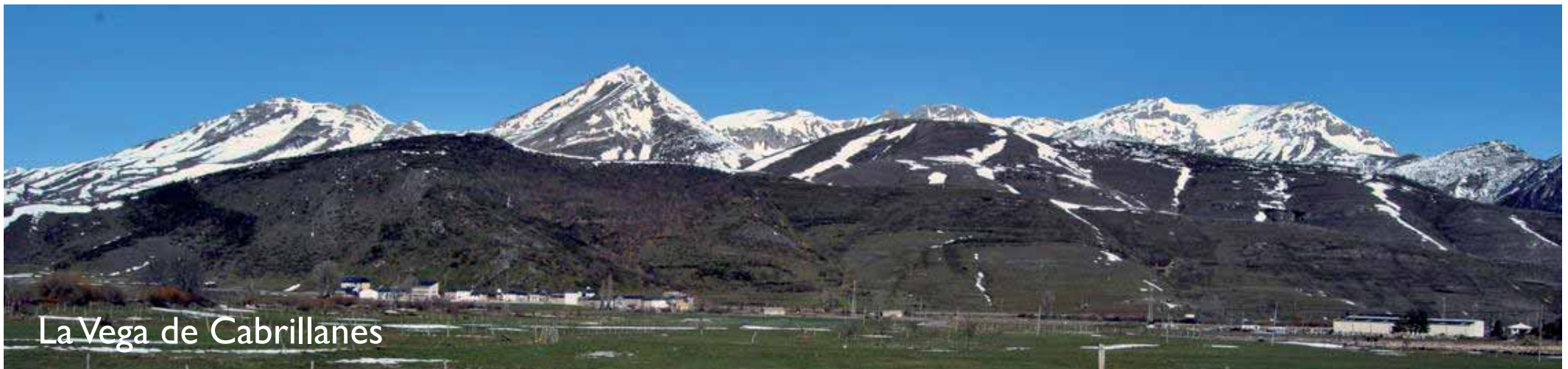
La Vega de Cabrillanes