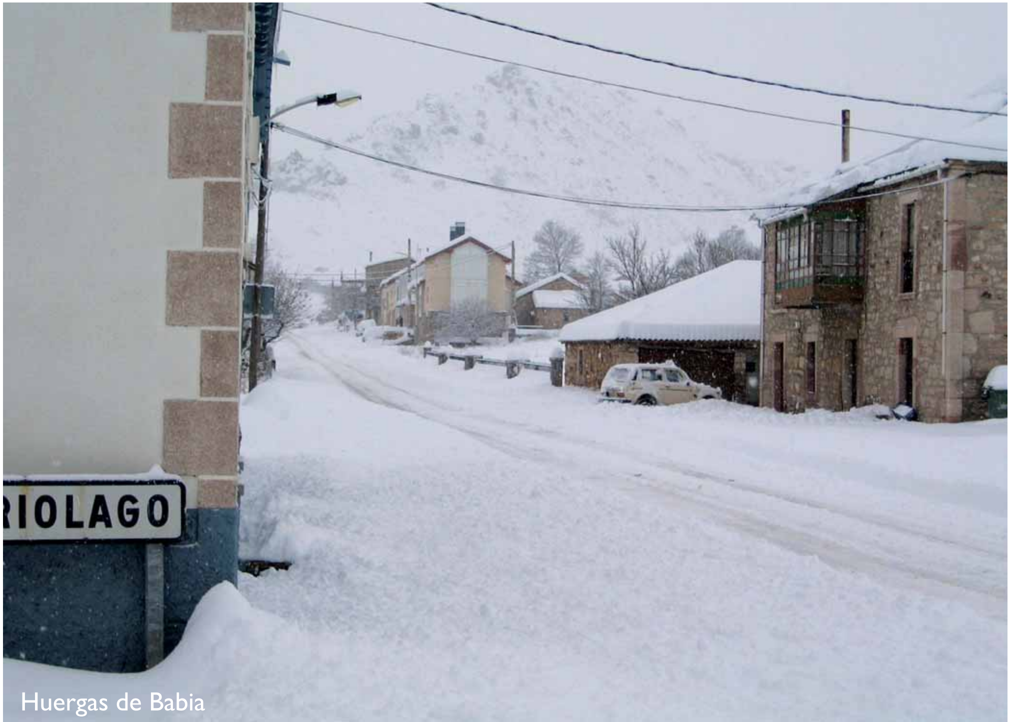
Huergas de Babia