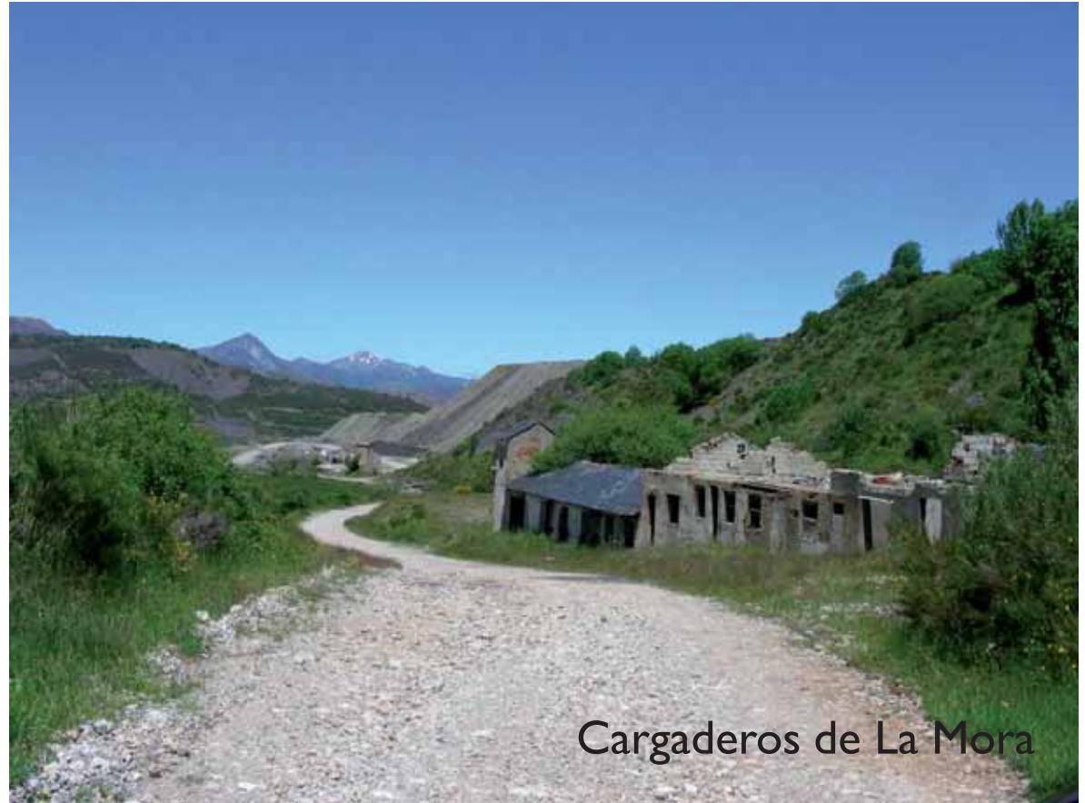
Cargaderos de La Mora

Además de Reserva de la Biosfera (2004) y StarPark (2014) este territorio está englobado en el LIC y ZEPA Valle de San Emiliano y próximamente será declarado Parque Natural, bajo el nombre de Babia y Luna, por la Junta de Castilla y León.