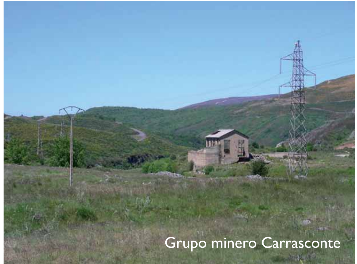
Grupo minero Carrasconte

Además de Reserva de la Biosfera (2004) y StarPark (2014) este territorio está englobado en el LIC y ZEPA Valle de San Emiliano y próximamente será declarado Parque Natural, bajo el nombre de Babia y Luna, por la Junta de Castilla y León.