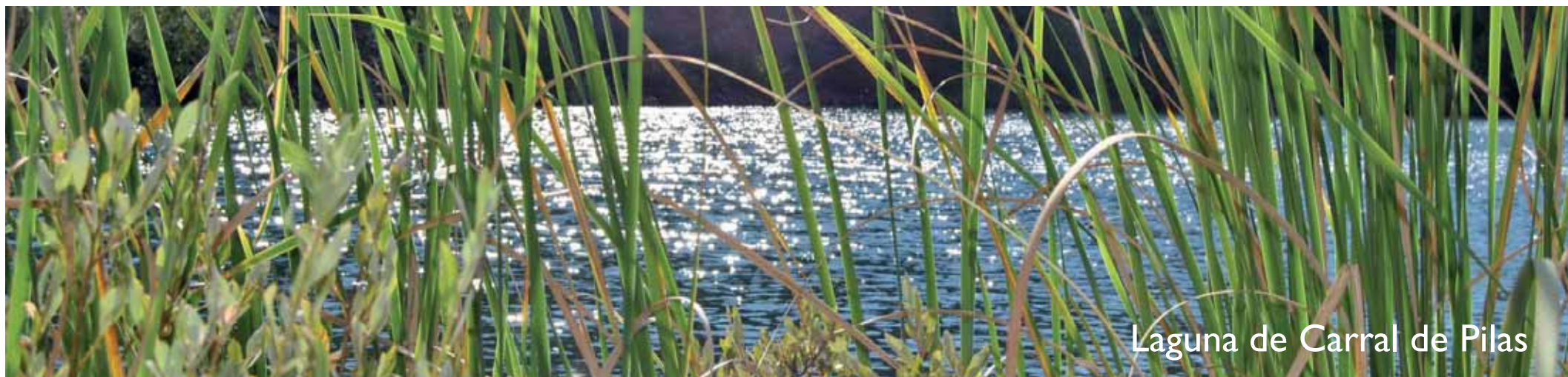
Laguna de Carral de Pilas