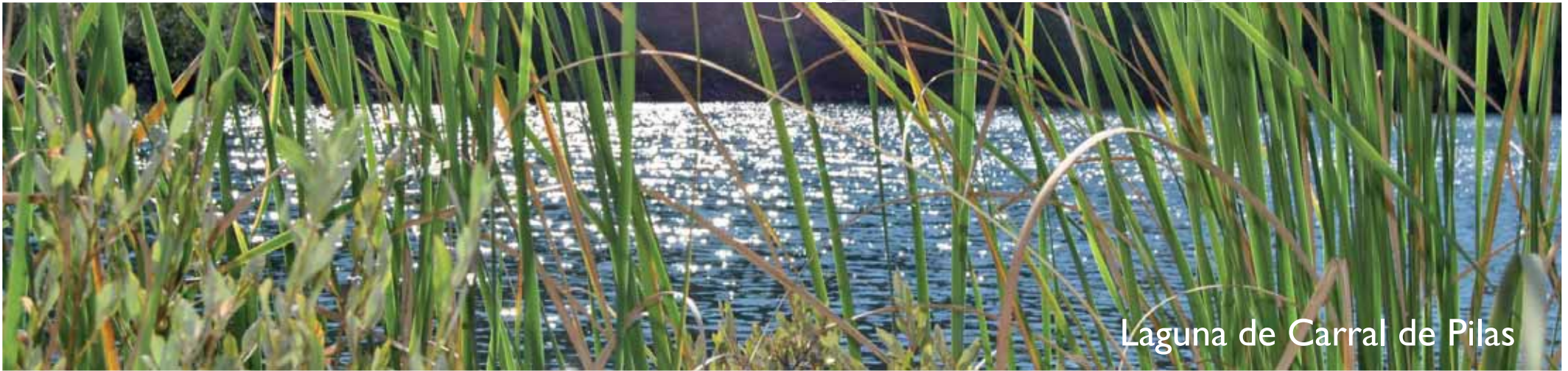
Laguna de Carral de Pilas