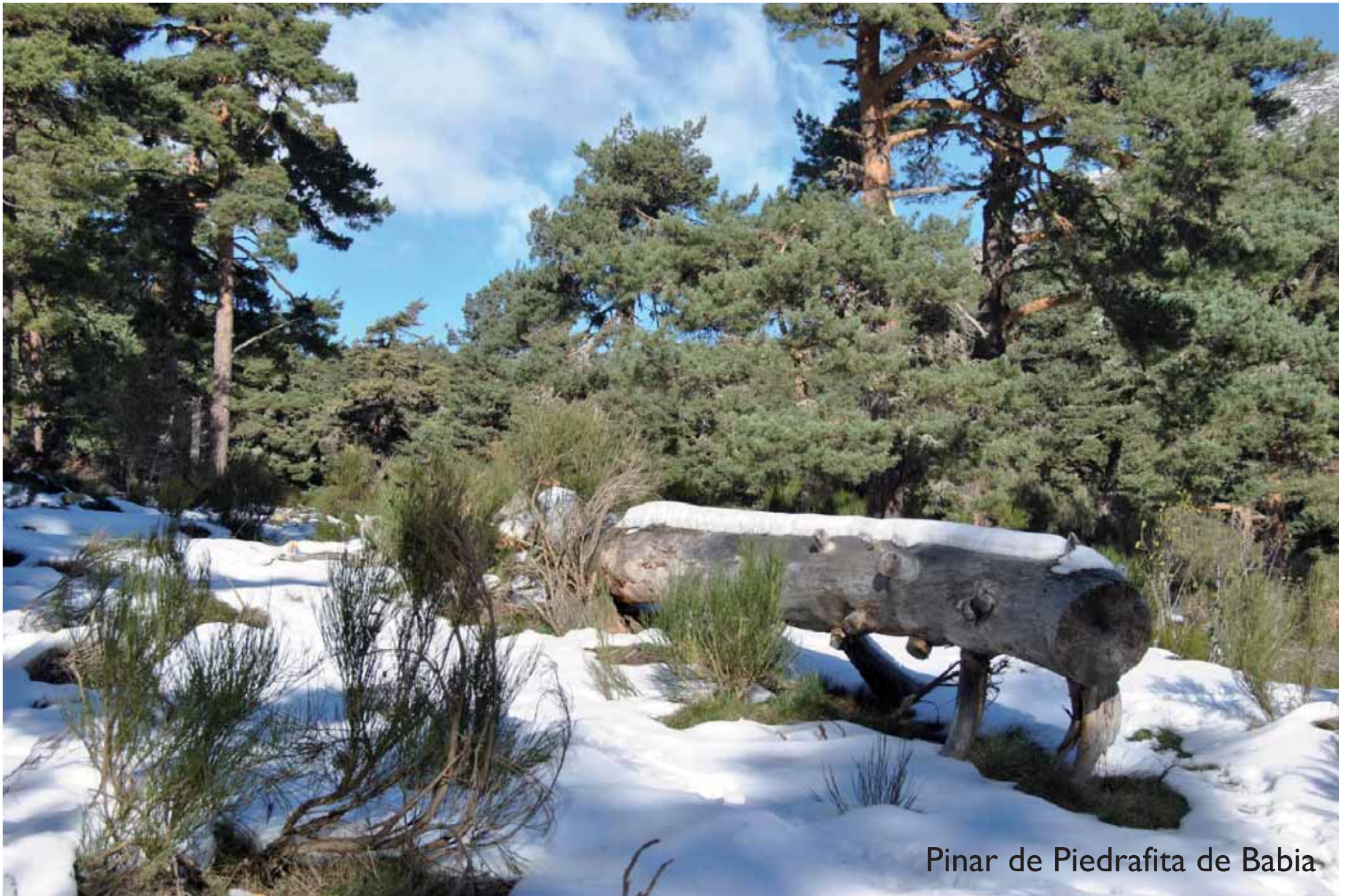
Pinar de Piedrafita de Babia