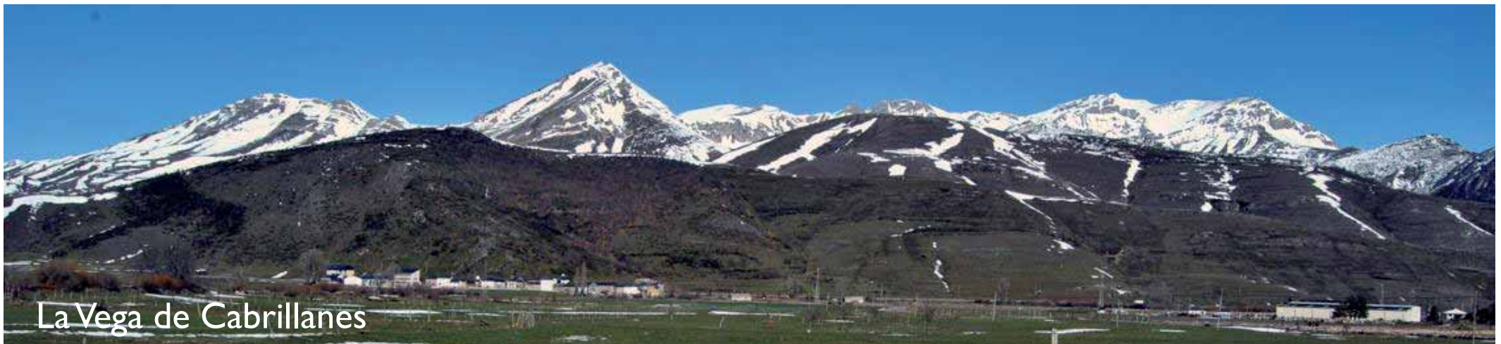
La Vega de Cabrillanes