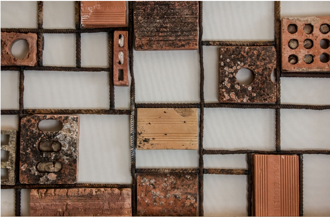
D'APRÈS MONDRIAN-Eduardo Domínguez Cabrerizo