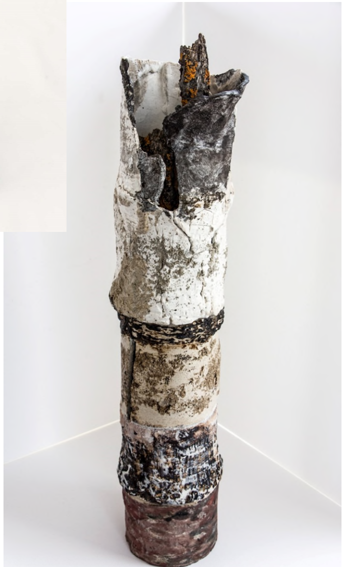
SIN TÍTULO- Rosa Villalón