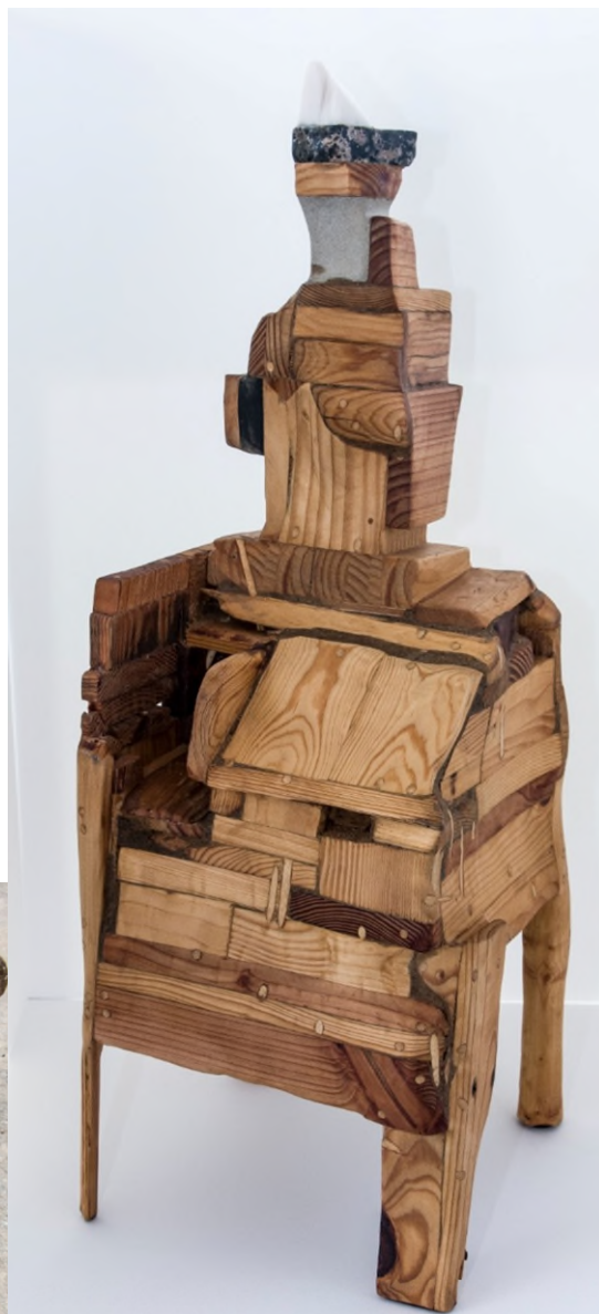
REFUGIO II, FRENTE AL SIGLO XXI-Denislav Mitkov