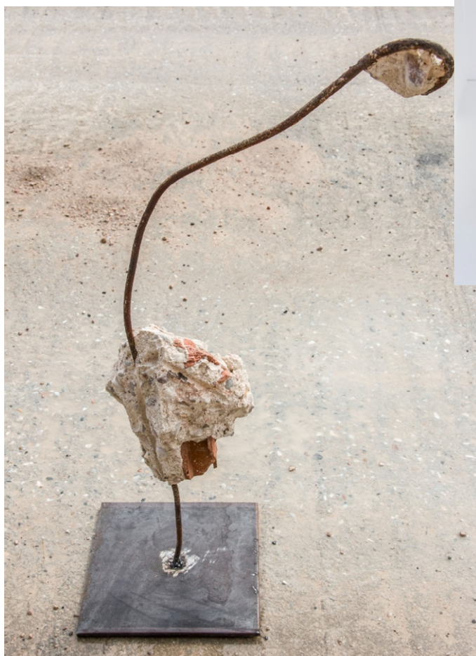
RARA AVIS-Luz Cano