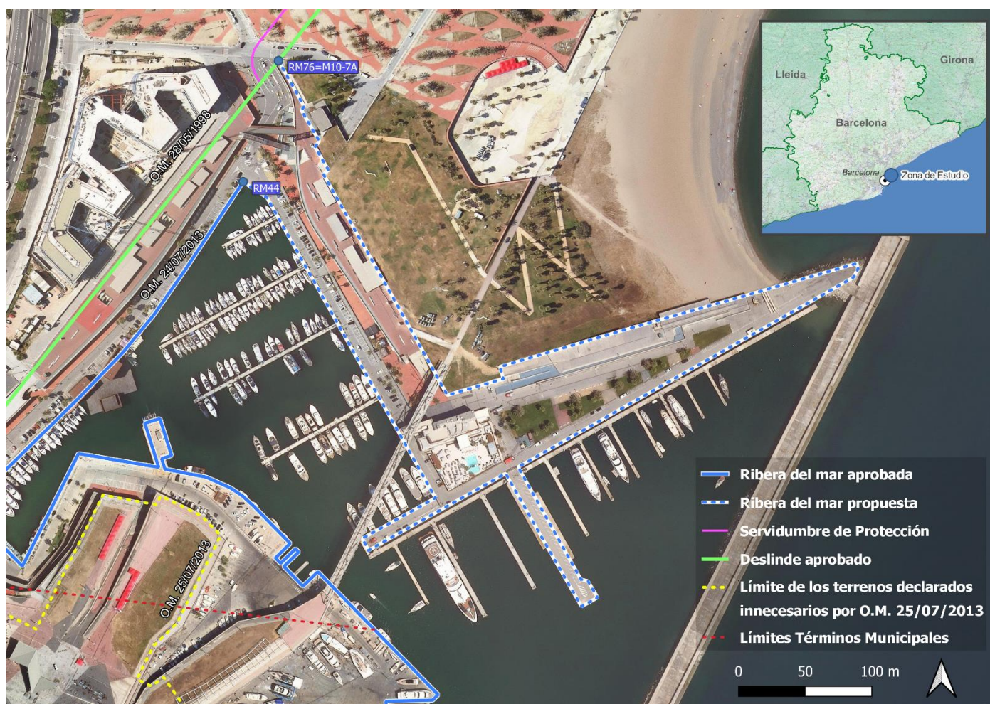
Ilustración 3 - Localización del área de estudio con la línea de ribera del mar propuesta, sobre ortofotografía del ICGC.

Por todo lo anterior, se redacta el presente informe para proponer el establecimiento de la ribera del mar en el tramo de costa del Port Fórum en el T.M. de Sant Adrià del Besós (Barcelona), entre los vértices M10-6 y M10-8, aproximadamente, del deslinde aprobado por O.M. de 28 de mayo de 1998.