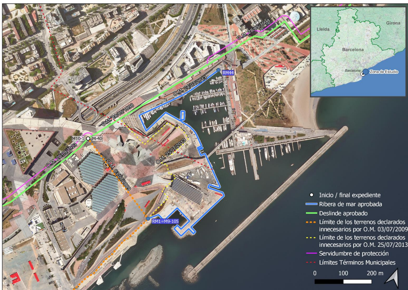
Ilustración 2 - Plano de situación de la zona de estudio, sobre ortofotografía del Institut Cartogràfic i Geològic de Catalunya (en adelante, ICGC).

Con la O.M. de 24 de julio de 2013 se aprueba el establecimiento de la ribera de mar de Port Forum, entre los vértices RM-1=M9-105 y RM-44.