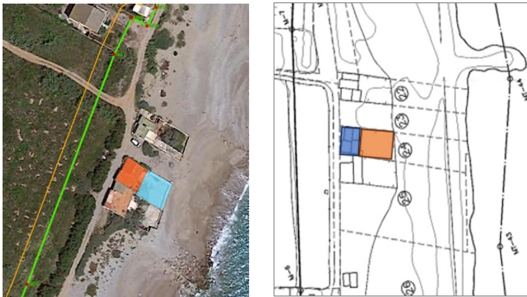
Imagen 2. Recorte ortofoto ICV con superposición de las líneas del deslinde y recorte plano deslinde aprobado por orden ministerial 13 de mayo de 1999 con indicación de la ocupación que se analiza (ELABORACIÓN PROPIA).

2. Mediante orden ministerial de 13 de enero de 1999, se aprueba el deslinde en el tramo norte o playa L´Alcudia, con una longitud de 721 metros (DL-31-CS). De acuerdo con el plano de deslinde, los terrenos se localizan en ribera de mar, entre los actuales hitos M-6 y M-7.