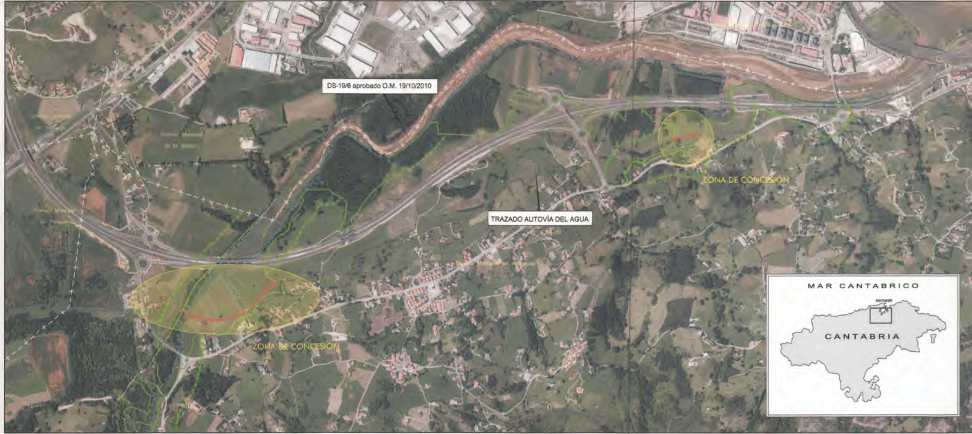
Plano general "Autovía del Agua" en el tramo San Salvador de Heras - Camargo T.M. Villaseca. Escala aproximada = 1:8,000