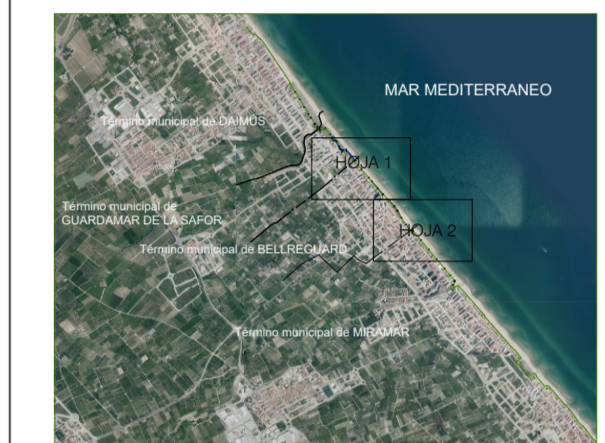
GRÁFICO DE DISTRIBUCIÓN DE HOJAS 1:1.000

GRÁFICO DE DISTRIBUCIÓN DE HOJAS 1:5.000