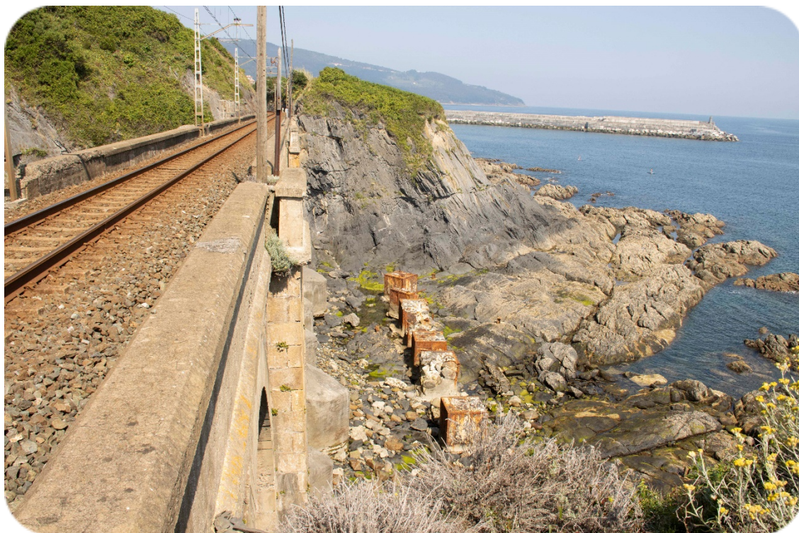
Foto 2. Vista del viaducto desde encima.

En este trabajo atravesamos andando toda el área de estudio, comenzando por las partes superiores y después bajando a la rasa desde ambos lados (este y oeste). En primer lugar, accedimos desde la BI-2235, para analizar la situación de las parcelas cubiertas por orlas arbustivas, prados y trinchera de la vía del tren (Foto 2). Desde allí pasamos a las partes altas del acantilado oriental, descendiendo hasta la rasa y desplazándonos hasta una cala próxima a Mundaka. Posteriormente, regresamos a la carretera y nos desplazamos hasta la punta contraria, el parking oeste, desde donde hay una senda que baja hasta la rasa. Una vez en la rasa, nos desplazamos por las rocas hasta el viaducto y sus inmediaciones. Obviamente, con marea baja y buen estado del mar.