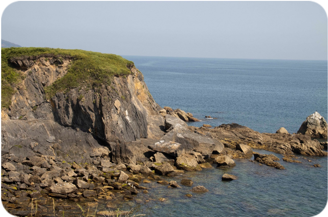
Foto 4. Ladera este del cabo situado al este del viaducto, dentro de la zona de estudio. A la derecha se observa una piedra que sobresale y que está cubierta de guano. En la punta descansa un cormorán moñudo. En el acantilado del cabo, además, se observan repisas con guano que se corresponden con zonas de descanso de las gaviotas. En la base se puede ver un grupo de gaviotas descansando.