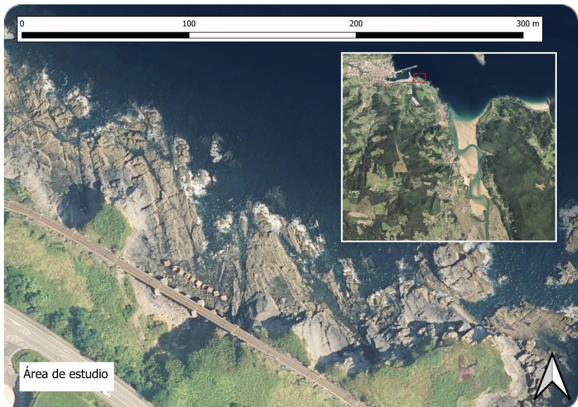
Figura 1. Viaducto de Mundaka y su entorno inmediato.

Actualmente la protección frente al oleaje del puente se compone de 10 dados de hormigón anclados al suelo de roca de la cala (ver Foto 1). Se proyecta substituirlos por un dique de hormigón, previa demolición de los dados existentes. La disposición de estas zapatas se realizará sin excavar el terreno natural de la cala.