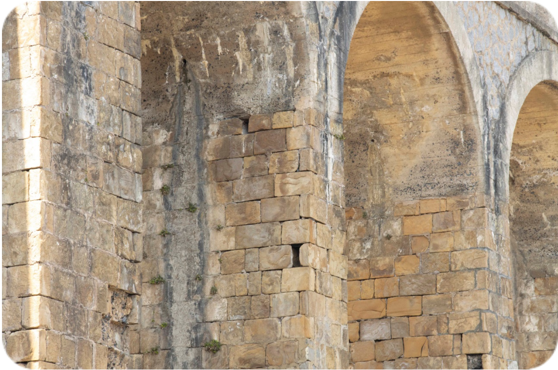
Foto 5. En la imagen se observa cómo los pilares presentan varios agujeros creados por la caída de piedras de la estructura. Estos agujeros son ideales para la nidificación de especies trogloditas. En el centro se observa un agujero con excrementos en su base, donde se encontraba uno de los nidos de cernícalo vulgar con pollos.