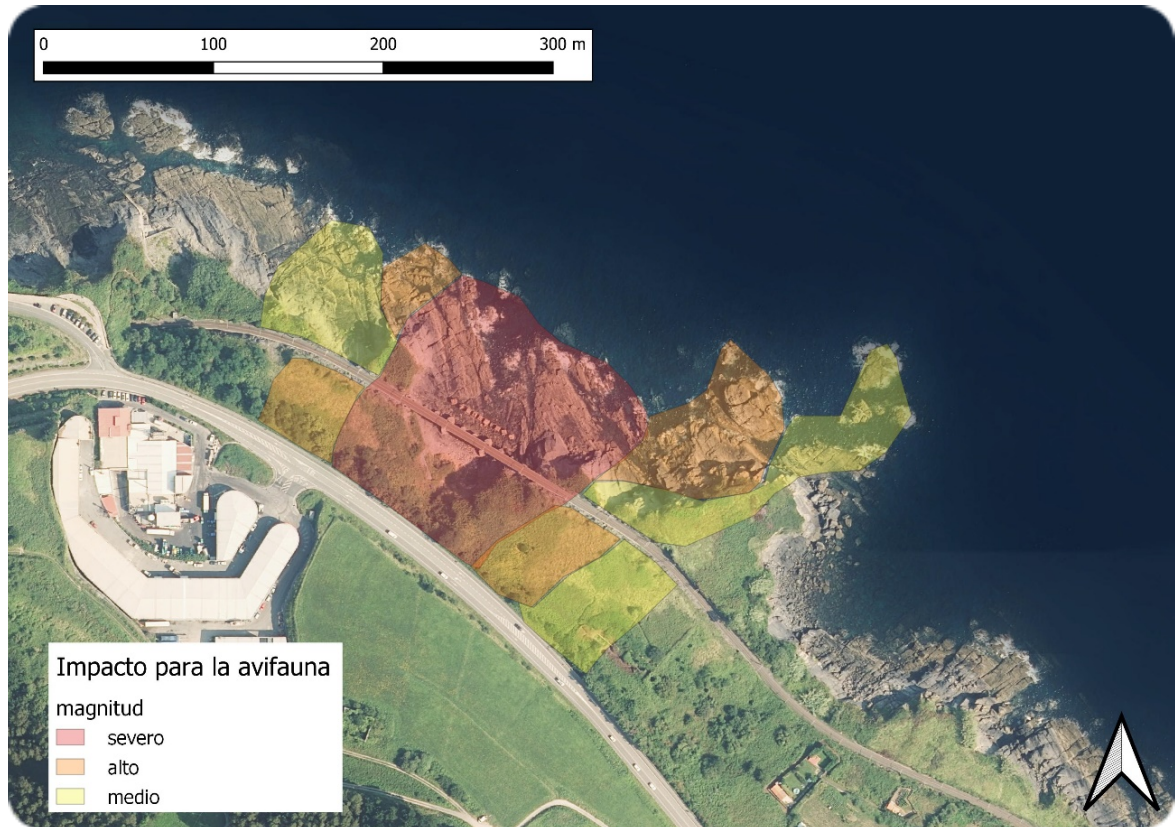
Figura 3. Distribución espacial de los impactos hacia las aves en función de su magnitud.