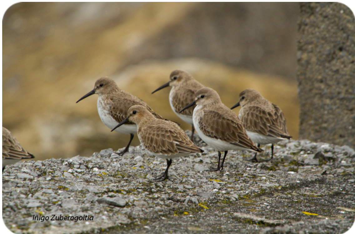
Foto 5. Grupo de correlimos comunes fotografiado en los diques de Bermeo el 2 de enero de 2013.

Además, la zona de estudio presenta tres tipos de comunidades de aves vinculadas a las características particulares del entorno, que deben ser tenidas en cuenta: