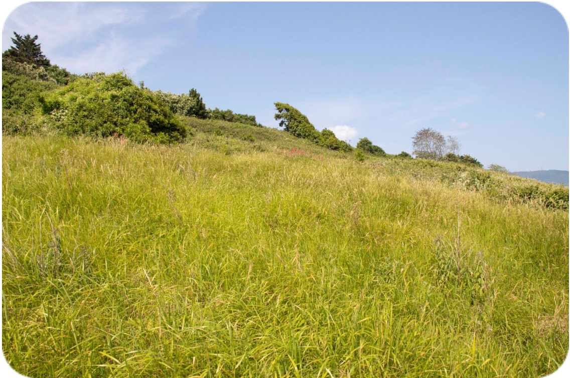
Foto 3. Prado encima de las vías del tren. Se observa el límite del prado y el comienzo con la orla arbustiva. En la zona intermedia prevalecen las zarzas, los saúcos menores y las madresevas.