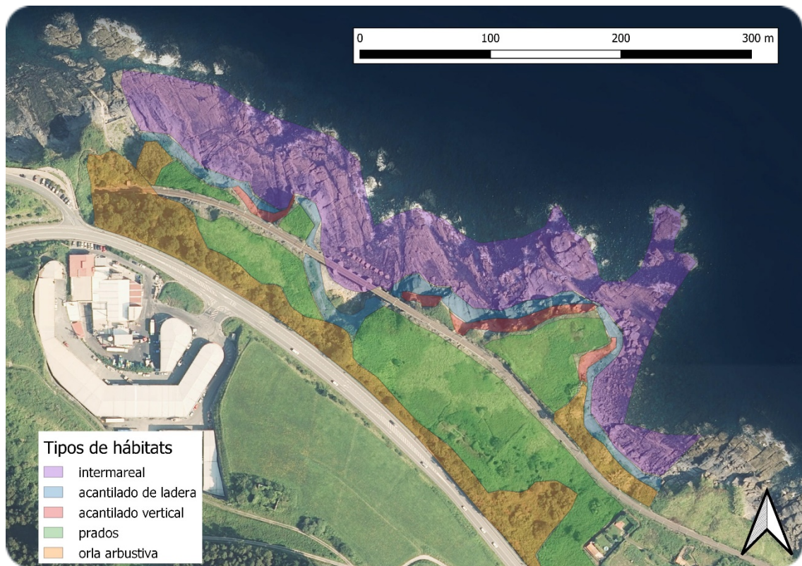
Figura 2. Hábitats de interés en la zona de estudio. Viaducto de Mundaka y su entorno inmediato.

Entre los hábitats de interés presentes en la zona de estudio y sus inmediaciones destacamos cinco tipos en función de las comunidades de aves que los usan (Fig. 2).