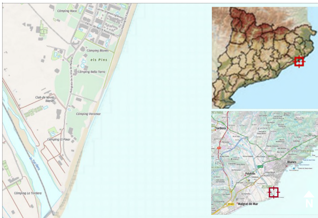
Figura 1. Situación de la zona de estudio

Esta playa comprende el tramo de costa desde la punta de Sa Palomera, al norte, hasta la desembocadura del río Tordera, al sur. Tiene una longitud de unos 2.500 metros totales y su anchura varía de 15 a 80 metros.