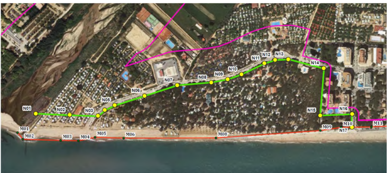
Figura 8. Deslinde vigente (en rojo) y delimitación propuesta en el estudio redactado por Tragsatec en diciembre de 2019 (en verde) con su correspondiente servidumbre de protección (en rosa).

Por tanto, de acuerdo con lo estipulado en la Normativa de Costas, en el tramo de unos 1140 m comprendido entre los vértices M-1 a M-11 del deslinde aprobado por Orden Ministerial de 5 de diciembre de 1969 procede establecer una anchura de la servidumbre de protección de 100 metros entre los vértices de la delimitación propuesta N-1 y N-13 (aproximadamente a 35 metros de este), siendo en el resto del tramo de 20 metros.