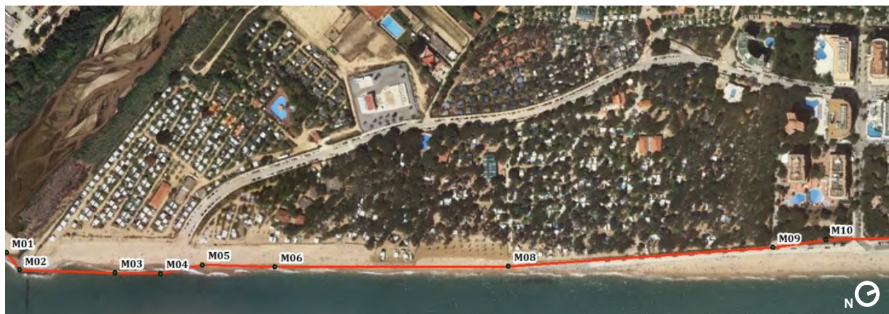
Figura 2. Deslinde vigente en la zona de estudio

Este tramo es de unos 1140 metros y se ubica entre los vértices M-1 a M-11 del deslinde aprobado por O.M. de 5 de diciembre de 1969.