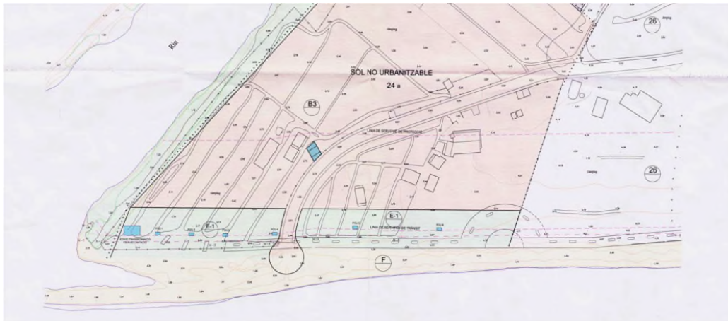
Figura 7. Extracto del plano de Modificación del Plan General del Sector El Pinar que clasifica los terrenos como Suelo No Urbanizable.

No obstante, los terrenos correspondientes al sector El Pinar fueron posteriormente reclasificados como Suelo No Urbanizable de acuerdo con la Modificación del Plan General del Sector El Pinar.