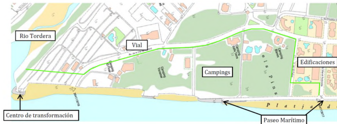
Figura 3. Descripción de la zona de estudio con deslinde propuesto

Desde el punto de vista sedimentario, el río Tordera es el que proporciona los sedimentos más gruesos en esta zona, por lo que, al situarse en su delta, la evolución y desarrollo de los terrenos objeto de estudio están relacionados con la dinámica de este (régimen fluvial y aporte de sedimentos), así como con la dinámica costera (corrientes marinas y deriva litoral). En cualquier caso, las actuaciones antrópicas han alterado estos dos factores.