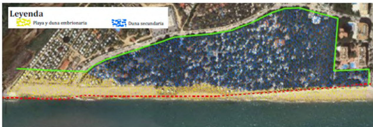
Figura 4. Clasificación dunar en base a la Normativa de Costas

Pese a las alteraciones producidas por la plantación de pinos en el siglo XIX, la antropización por uso de los terrenos litorales como zona de cultivos o campings y la regresión de la línea del mar, el estudio concluye que, según lo establecido en el artículo 3.1.b) de la Ley de Costas y en los artículos 3 y 4 del Reglamento General de Costas, el tramo objeto de estudio está formado por dunas que se consideran necesarias para garantizar la estabilidad de la playa y la defensa de la costa y, por tanto, constitutivas de DPM-T.