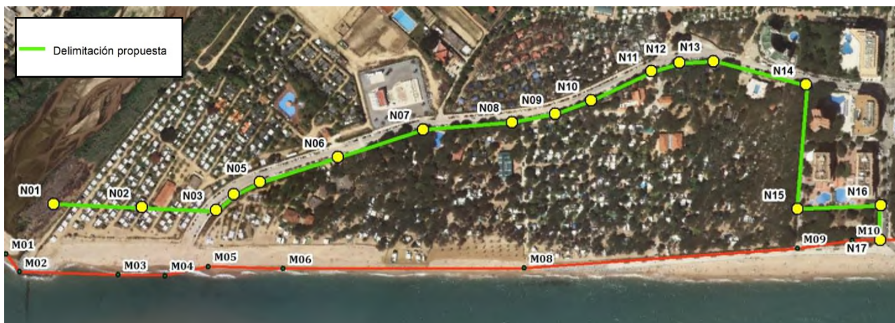
Figura 6. Propuesta de DPM-T

En conclusión, la poligonal del deslinde reflejado en el proyecto tiene una longitud aproximada de 1.142 m, y está definida por 17 vértices, desde el vértice N-1, situado en la desembocadura del río Tordera, hasta el vértice N-17, situado en el paseo marítimo, incluyendo la playa y dunas embrionarias, así como el cordón dunar secundario.