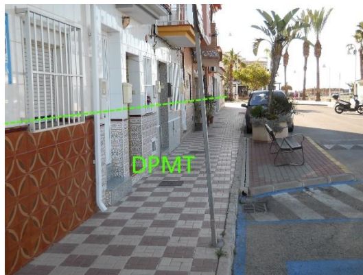
Figura 6: Fotografías del detalle de las ocupaciones entre los vértices M-2 y M-3.