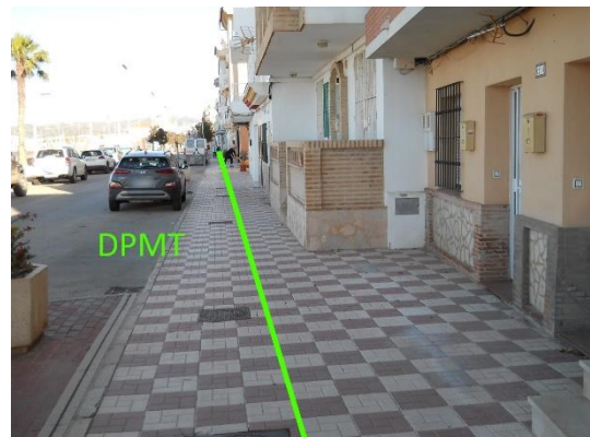
Figura 2: Fotografías del detalle de las ocupaciones entre los vértices M-1 y M-2.