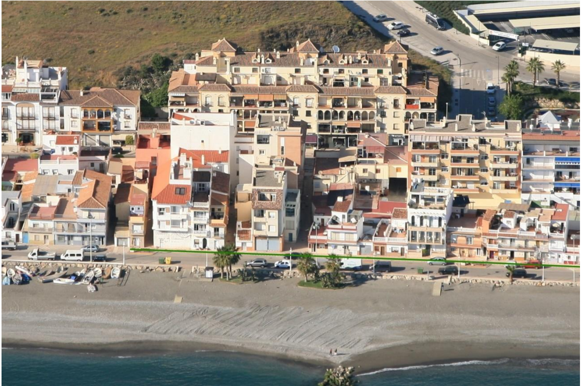
Figura 1: Ocupaciones del DPMT marcado por la línea verde sobre fotografía oblicua del año 2017, entre los vértices M-1 y M-2.