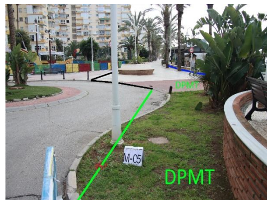
Figura 8: Fotografías del detalle de las ocupaciones entre los vértices M-3 y M-6.