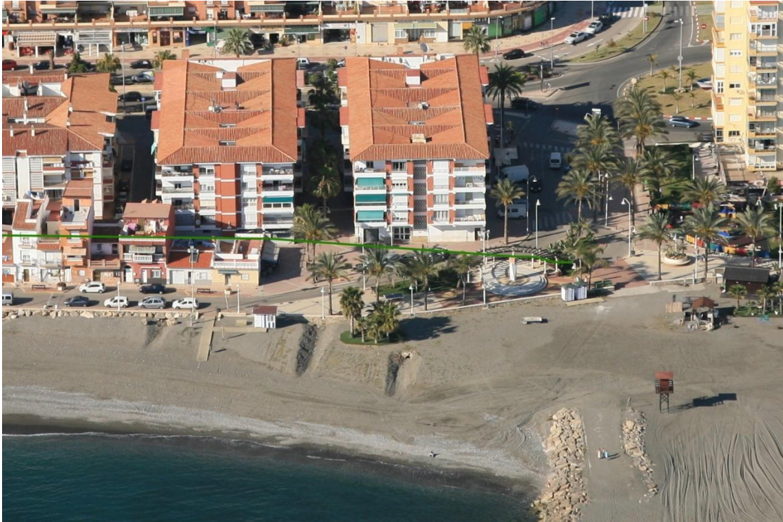
Figura 7: Ocupaciones del DPMT marcado por la línea verde sobre fotografía oblicua del año 2017, entre los vértices M-3 y M-6.