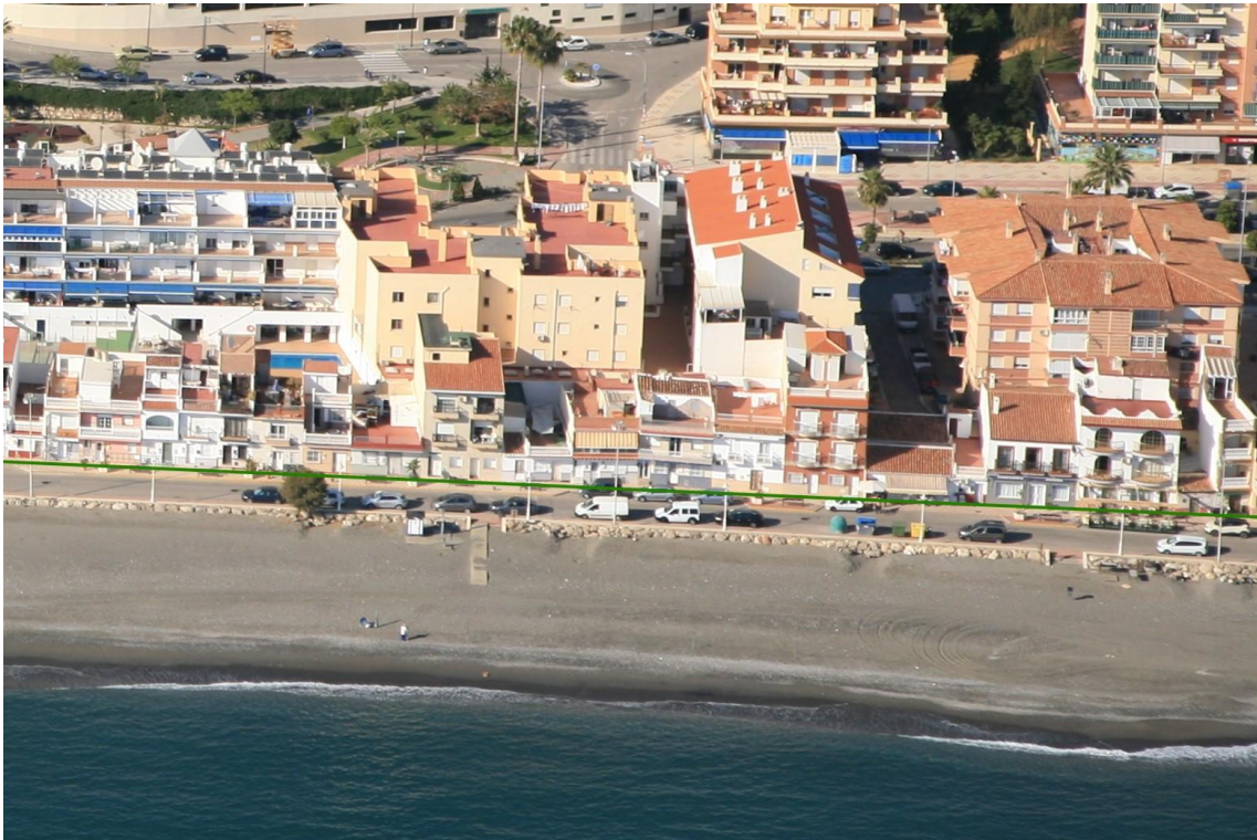
Figura 3: Ocupaciones del DPMT marcado por la línea verde sobre fotografía oblicua del año 2017, entre los vértices M-2 y M-3.