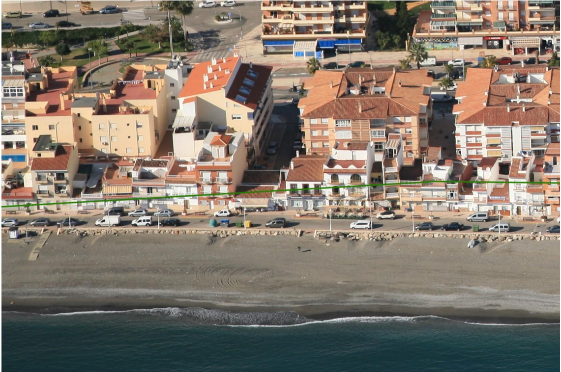
Figura 5: Ocupaciones del DPMT marcado por la línea verde sobre fotografía oblicua del año 2017, entre los vértices M-2 y M-3.