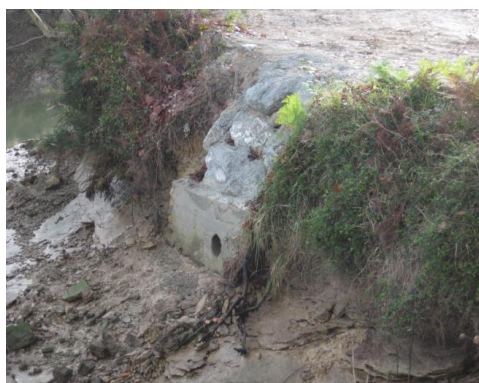
Pava de accionamiento y tubo de salida a la ría del desagüe 6

Tras la ventosa número 6 la conducción desciende por el talud de la ría, donde se ejecutó una pieza especial en calderería mediante acero estirado galvanizado de 800 mm de diámetro y PN25 embreada. Mediante esta pieza se conecta el tramo de tubería que va por el camino con el cruce bajo la ría del Escudo el cual se ejecutó a cielo abierto recubriéndose el tubo de fundición mediante hormigón en masa, además de protegerlo mediante un film plástico. En este tramo del cruce de ría se aprovechó para meter por encima del tubo de fundición 6 tubos corrugados de E-ON embebidos en hormigón en masa.