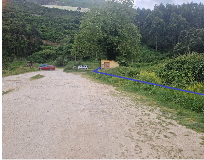
Trazado de las tuberías en la zona de Servidumbre de Protección:

INFORME DE FIRMA, no sustituye al documento original | C.S.V. : GEISER-2327-79f8-b401-935c-aec6-7ce0-ae30-e9ac | Puede verificar la integridad de este documento en la siguiente dirección: https://run.gob.es/hsbzyvmpyF