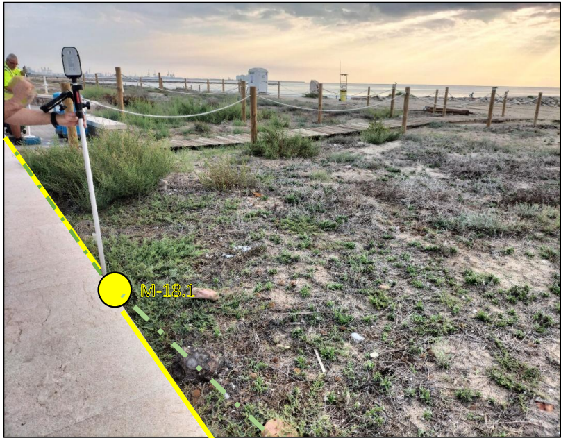
Figura 5.- Deslinde vigente y propuesto entre los vértices M-18 y M-19.

Proyecto de “Deslinde de los bienes de dominio público marítimo-terrestre en el tramo de costa comprendido entre los vértices M-15 y M-21 del deslinde aprobado por Orden Ministerial de 26 de abril de 1994, en el término municipal de Puzol (Valencia).” MEMORIA