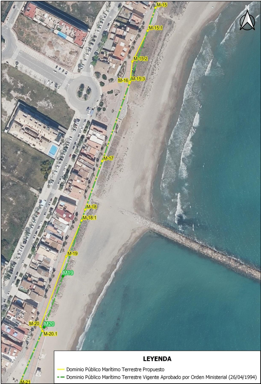
Figura 3.- Deslinde propuesto (trazo amarillo) y deslinde aprobado por O.M. 26/04/1994 (trazo verde).

Proyecto de “Deslinde de los bienes de dominio público marítimo-terrestre en el tramo de costa comprendido entre los vértices M-15 y M-21 del deslinde aprobado por Orden Ministerial de 26 de abril de 1994, en el término municipal de Puzol (Valencia).” MEMORIA