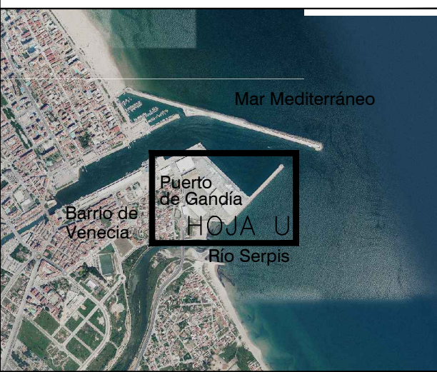
GRÁFICO DE DISTRIBUCIÓN DE HOJAS 1:1.000

GRÁFICO DE DISTRIBUCIÓN DE HOJAS 1:5.000