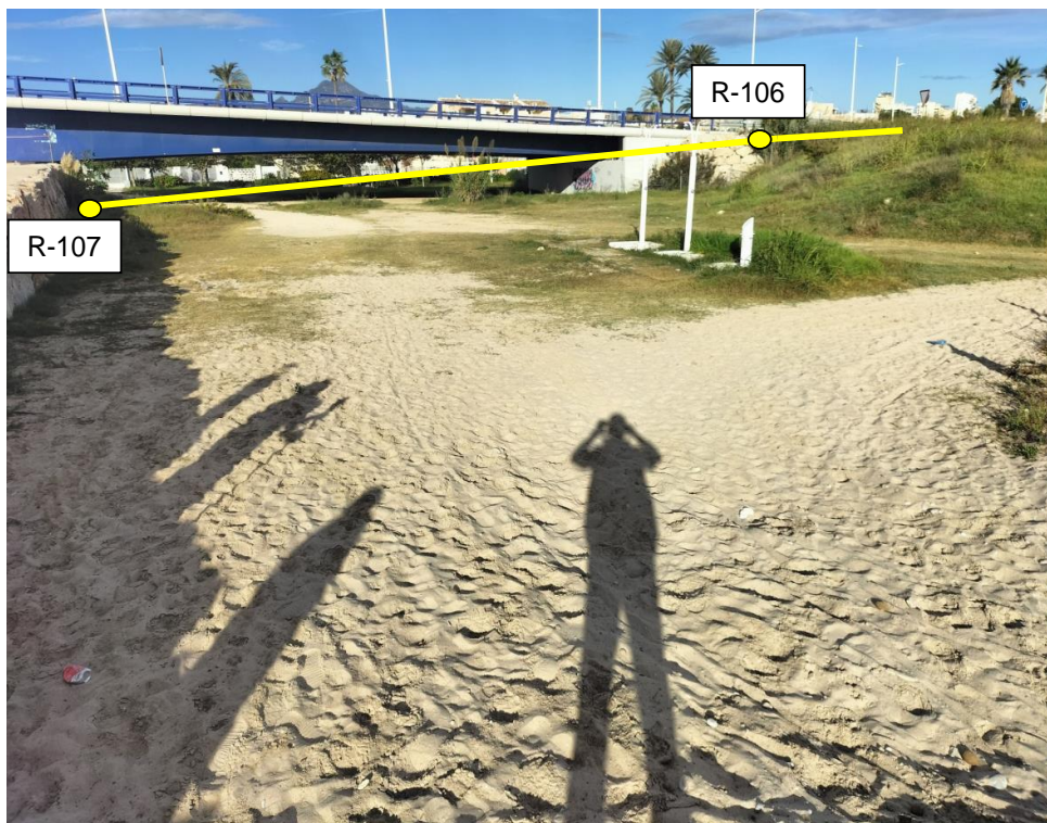
Figura 8. Detalle de la propuesta de delimitación entre los vértices R-106 y R-107 (RM propuesta)