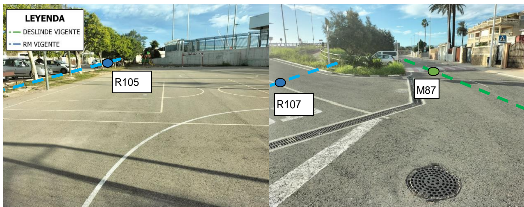
Figuras 4 y 5. Vista de las instalaciones deportivas al oeste del puerto (izquierda) y del vial que delimita el barrio de Venecia (derecha).

Mas al interior los terrenos de ribera del mar están ocupados por viales, superficies ajardinadas, instalaciones deportivas y otras construcciones.