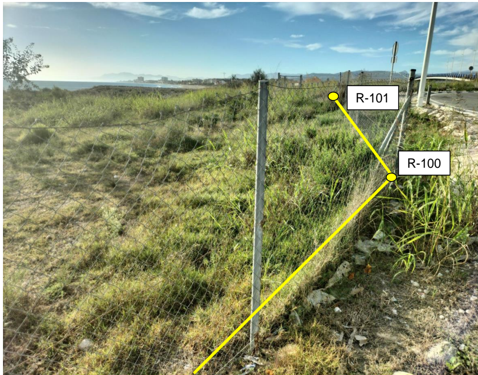
Figura 7. Detalle de la propuesta de delimitación entre los vértices R-99 y R-101 (RM propuesta).