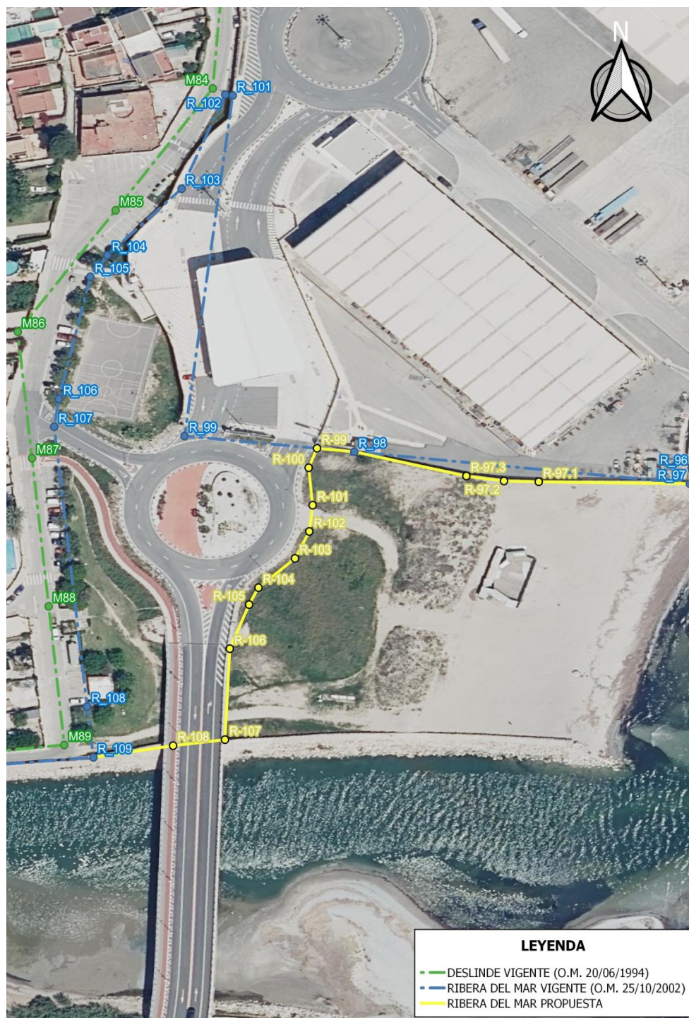
Figura 6. DPMT y RM vigente, y Ribera del mar propuesta sobre ortofotografía de 2022.

Con base en los antecedentes administrativos, de la visita de campo realizada, se efectúa la propuesta de delimitación de la ribera del mar ajustada a los terrenos que conservan sus características de ribera del mar. Para ello se crean 3 vértices nuevos (R-97.1 a R-97.3).