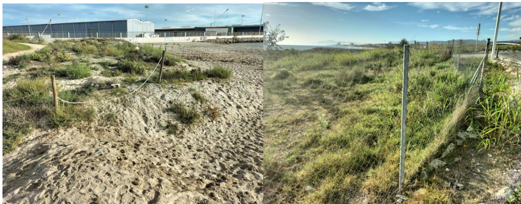
Figuras 2 y 3. Vista de la Playa de Venecia (izquierda) y vallado junto a la carretera (derecha).

En este tramo la playa, conocida como Playa de Venecia, está formada por arena, con un frente dunar paralelo a la línea de costa.