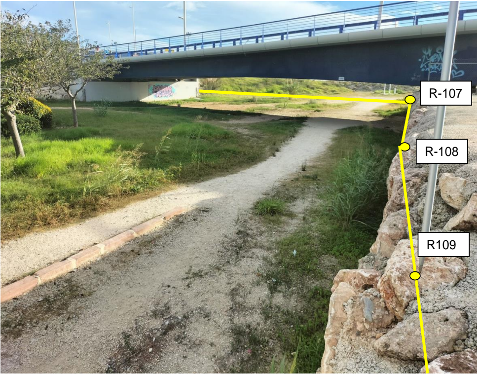
Figura 9. Detalle de la propuesta de delimitación entre los vértices R-106 y R109 (RM propuesta).

La delimitación propuesta se ajusta a los bienes que cuentan con las propiedades definidas en el artículo 3.1 apartado b) de la Ley 22/1988, de 28 de julio, de Costas, “ Las playas o zonas de depósito de materiales sueltos, tales como arenas, gravas y guijarros, incluyendo escarpes, bermas y dunas, estas últimas se incluirán hasta el límite que resulte necesario para garantizar la estabilidad de la playa y la defensa de la costa. ”.