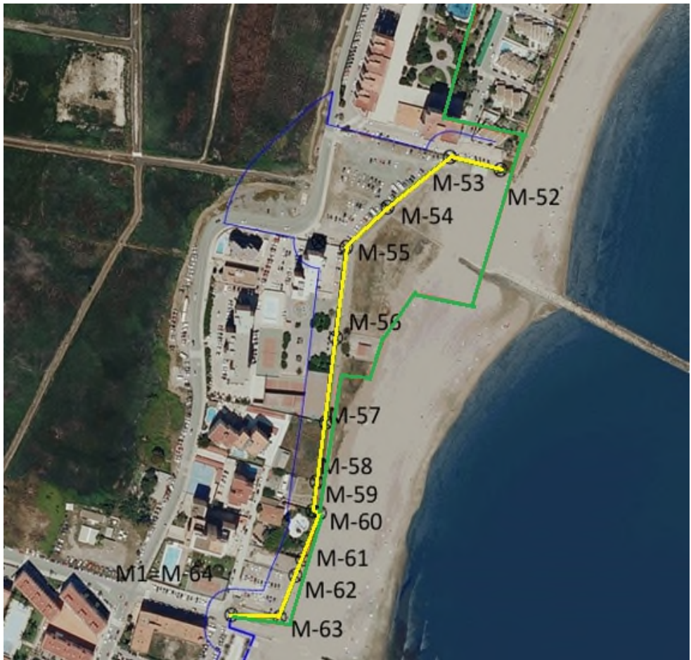
Figura 2.- Deslinde de ZMT O.M. 3/10/1969 (trazo verde) y propuesta deslinde (trazo amarillo). En trazo azul se representa la servidumbre de protección. La ribera del mar es coincidente con el deslinde propuesto