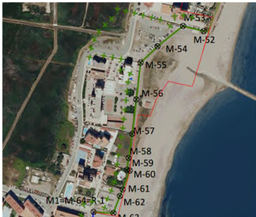
Figura 4.- Propuesta de deslinde tras el estudio de las alegaciones.

De acuerdo con el artículo 23.1 de la Ley 22/1988, de 28 de julio, de Costas “la servidumbre de protección recaerá sobre una zona de 100 metros medida tierra adentro desde el límite interior de la ribera de mar”. Y en la Disposición Transitoria Tercera en su punto 3 especifica que “los terrenos calificados como suelo urbano a la entrada en vigor de la presente Ley estarán sujetos a las servidumbres establecidas en ella, con la salvedad de que la anchura de la servidumbre de protección será de 20 metros.”