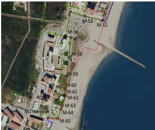
Figura 3.- Propuesta provisional del deslinde.