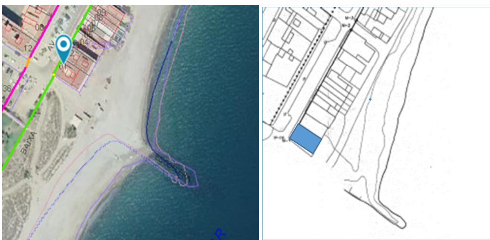
Imagen 2. Ortofoto con superposición de las líneas del deslinde y plano aprobado por orden ministerial 13 de junio de 2000.

De acuerdo con el plano de deslinde, los terrenos se localizan en ribera de mar, entre los actuales hitos M-1 y M-2.