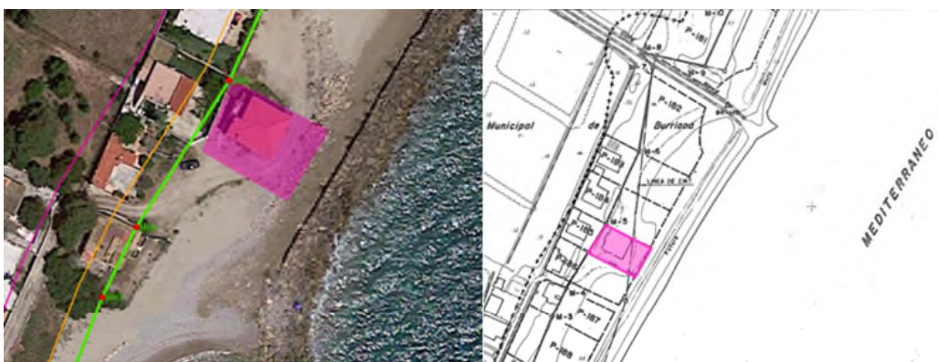
Imagen 2. Plano y ortofoto con superposición de las líneas del deslinde aprobado por orden ministerial 7 de septiembre de 1998.

2. Mediante Orden Ministerial de 7 de septiembre de 1998, se aprueba el deslinde en el tramo Puerto-TM Nules del término municipal de Burriana (Castellón) y con una longitud de 3.335 metros (DL-10-CS). De acuerdo con el plano de deslinde, los terrenos se localizan en ribera de mar, entre los actuales hitos M-4 y M-5.