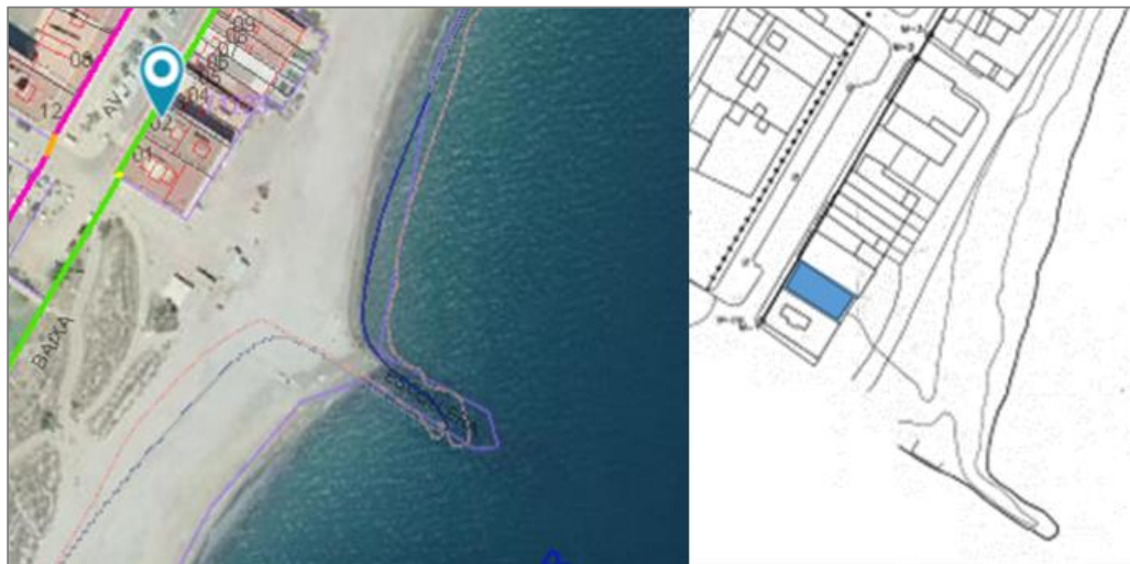
Imagen 2. Ortofoto con superposición de las líneas del deslinde y plano aprobado por orden ministerial 13 de junio de 2000.

2. Mediante Orden Ministerial de 13 de junio de 2000, se aprueba el deslinde en el tramo poblado marítimo o playa Bovalar, con una longitud de 1.980 metros (DL-40-CS). De acuerdo con el plano de deslinde, los terrenos se localizan en ribera de mar, entre los actuales hitos M-1 y M-2.