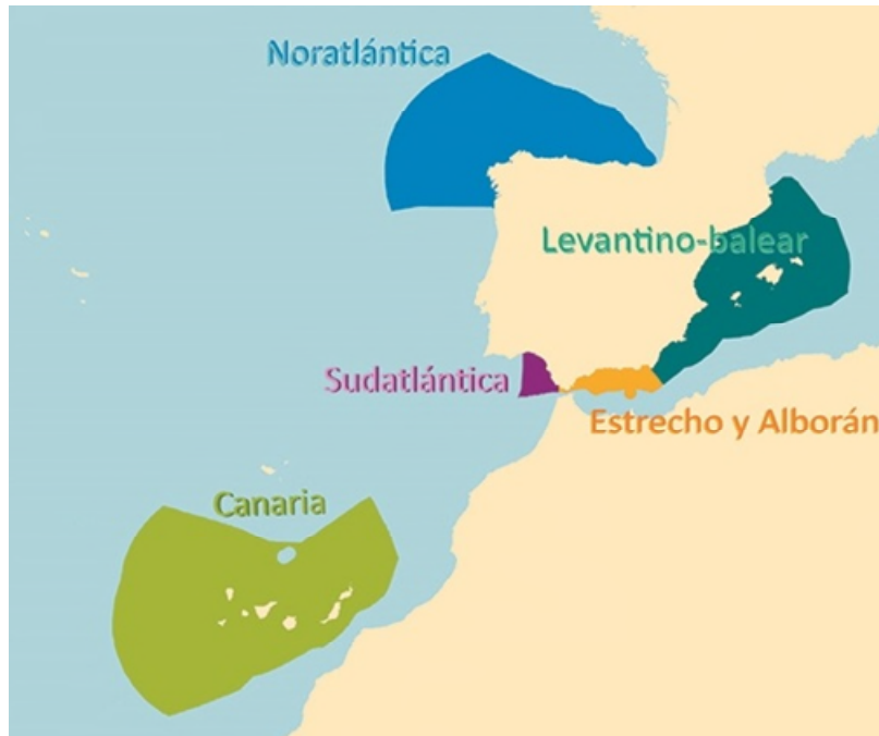
Figura 1. Las cinco demarcaciones marinas de España. (NOTA: Este mapa es para uso técnico y no refleja los límites entre Estados vecinos).

aguas marinas españolas, regulados por su normativa específica, y sin perjuicio de las modificaciones que aquellos puedan sufrir en el futuro.