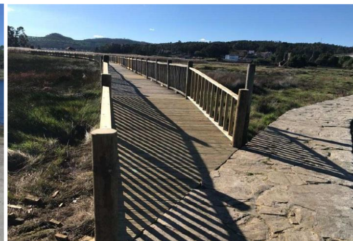
Después de la obra