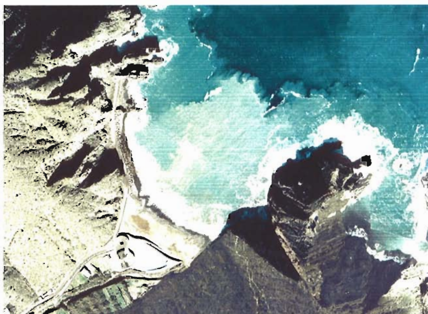
Figura 150. Año 2003