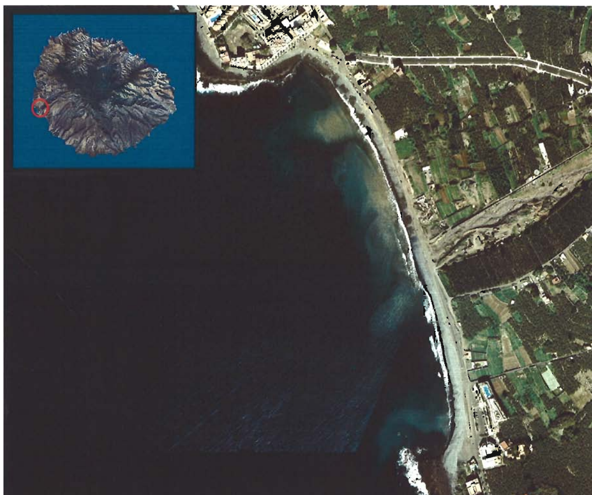
Figura 172. Playa de Valle Gran Rey (Isla de La Gomera).