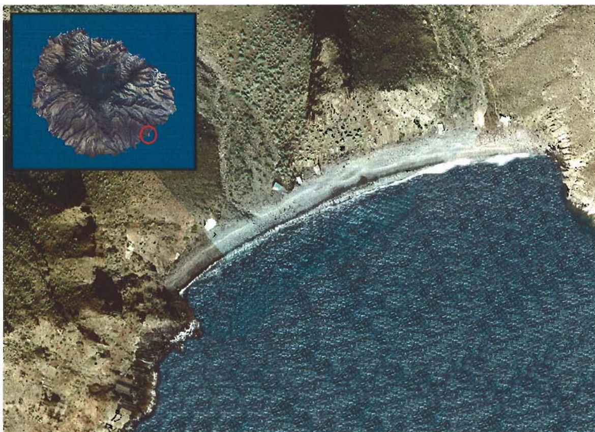
Figura 55. Playa de La Roja (Isla de La Gomera).