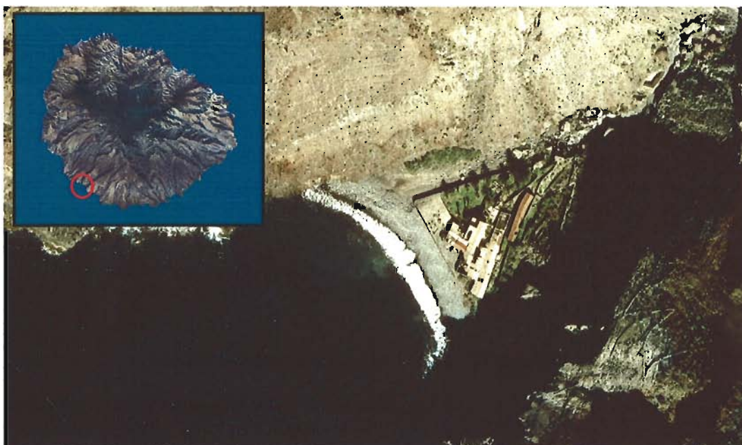
Figura 103. Playa de La Cantera (Isla de La Gomera).