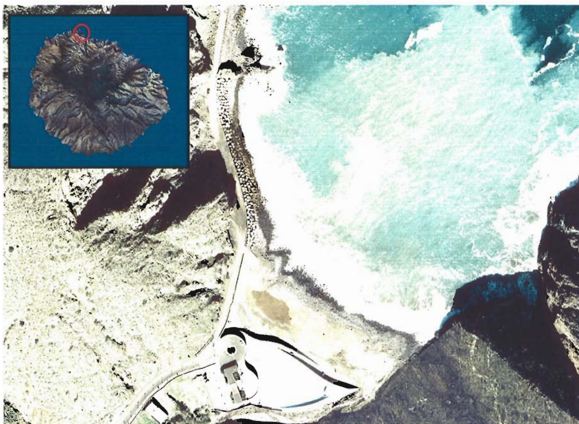
Figura 147. Playa de Vallehermoso (Isla de La Gomera).