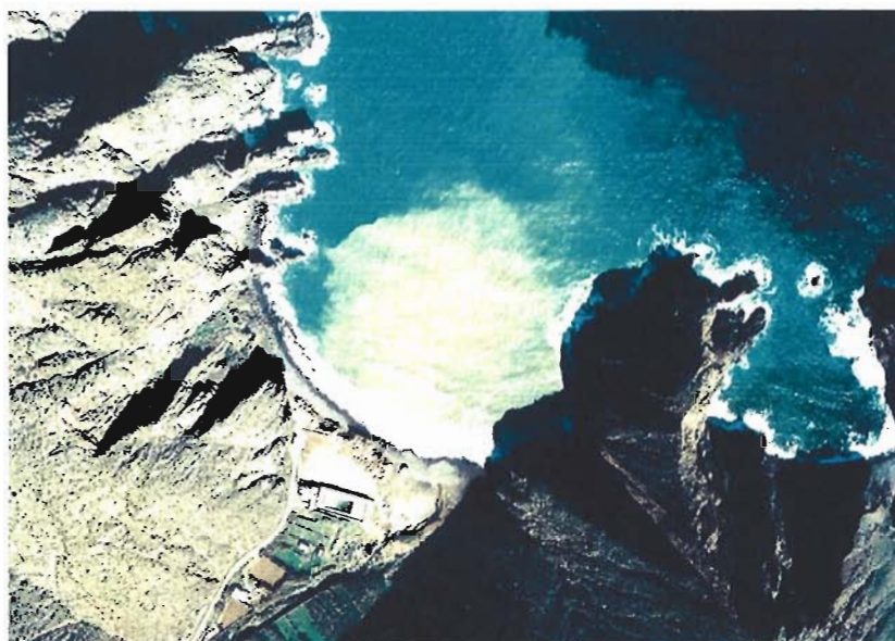
Figura 149. Año 1989