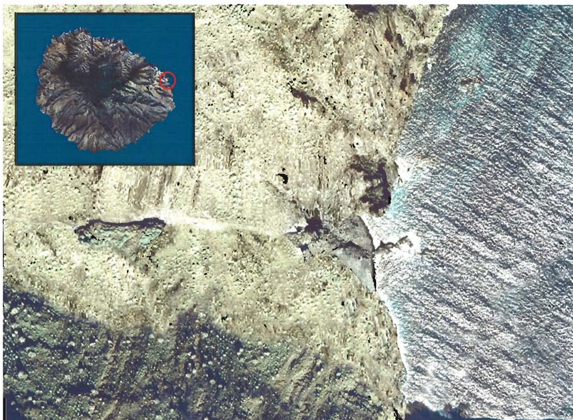
Figura 13. Playa de Zamora (Isla de La Gomera).