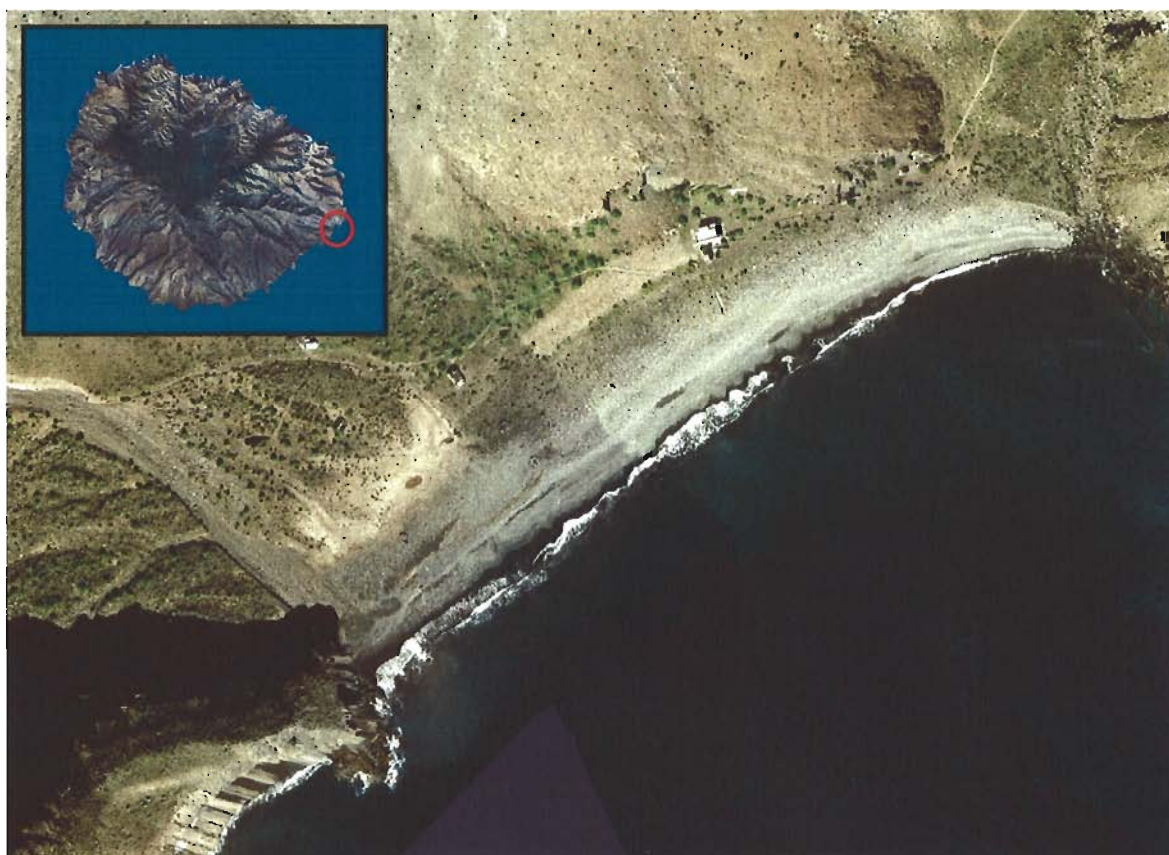
Figura 44. Playa de La Guancha (Isla de La Gomera).