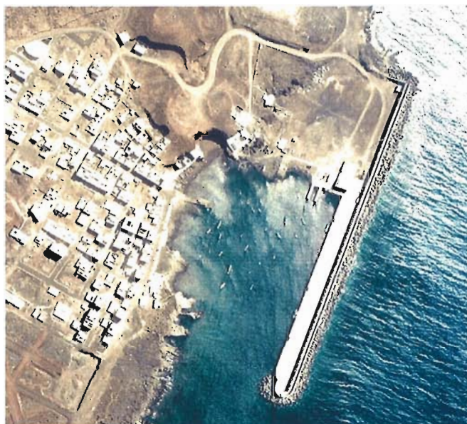
Figura 3. Año 1989