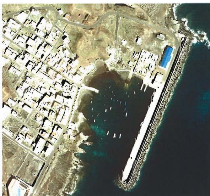
Figura 4. Año 2003