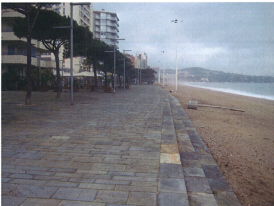
F3 -Zona de Regeneraci3n Platja d'Aro