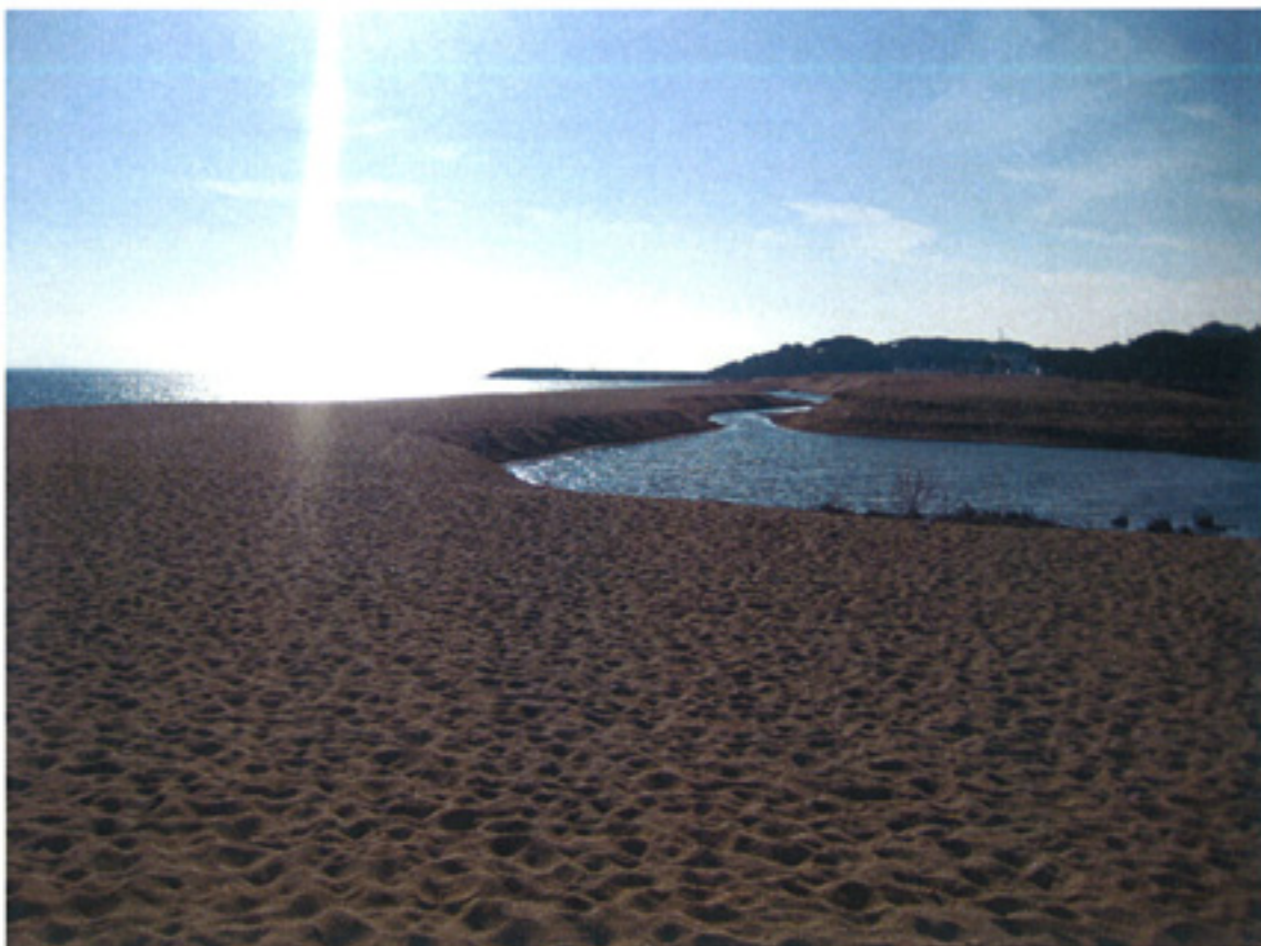
F4- Zona de extracción Riera Ridaura