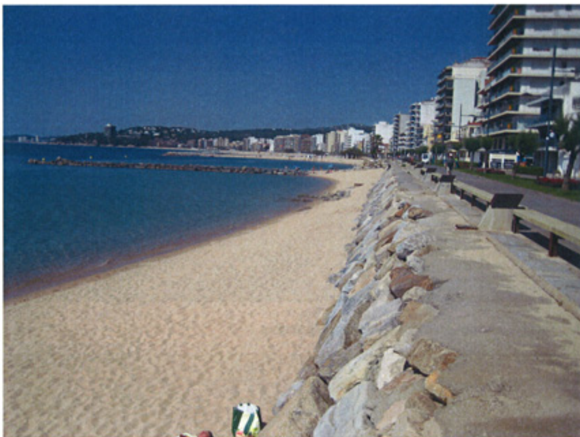
F1 – Calonge zona para regenerar.

Traspase de arena de la zona de desembocadura de la riera a zona de pérdida de arena en los T.M. de Calonge y Platja d'Aro