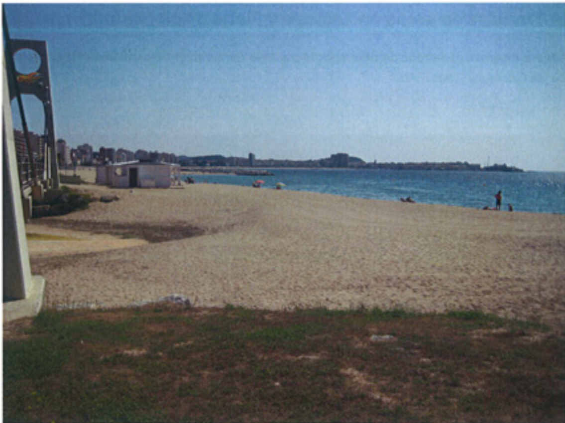
F2 – Calonge zona de extracci3n desembocadura riera.