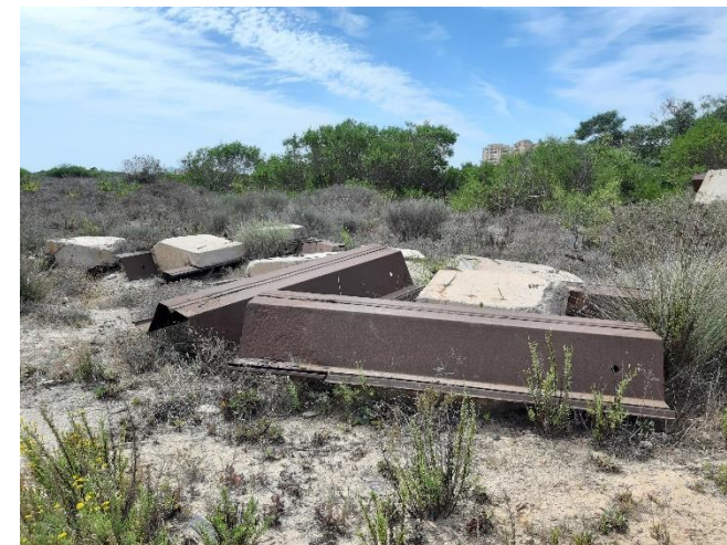
Imagen 32. Restos de tablestacas abandonadas en la Caleta del Estacio (Septiembre 2022)