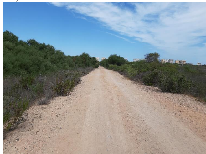
Imagen 30. Camino principal de la Caleta del Estacio delimitado por densos bosquetes de acacias (Septiembre 2022)