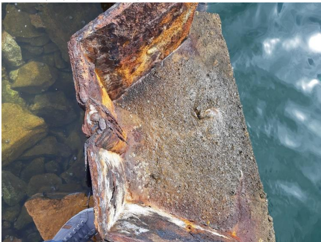
Imagen 9. Corrosión en las tablestacas de las antiguas instalaciones de Puerto Mayor (Septiembre 2022)