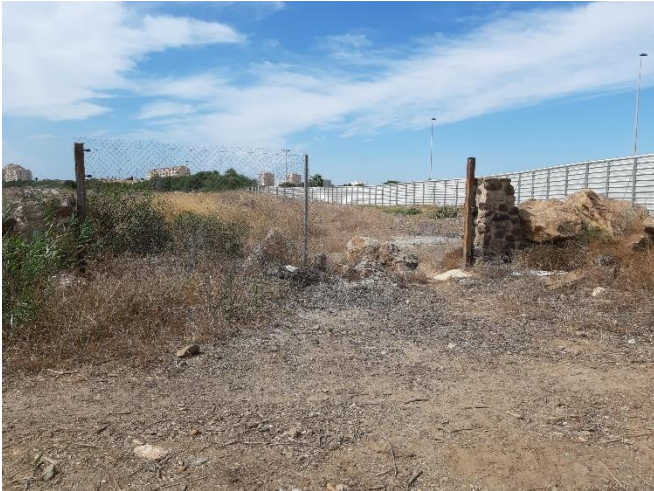
Imagen 17. Acceso norte y delimitación actual de la Caleta del Estacio (Septiembre 2022)