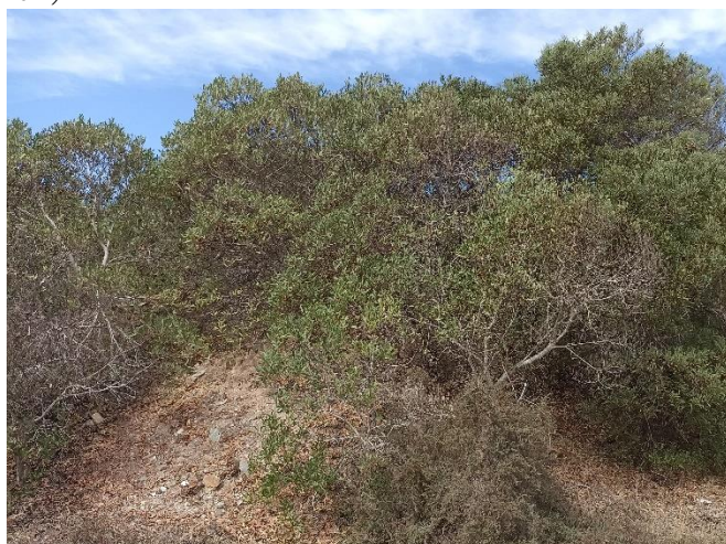
Imagen 29. Acacias en el montículo existente en primera línea, formado por materiales de relleno (septiembre 2022)