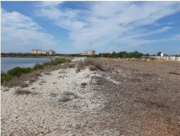
Imagen 1. Dunas primarias en el Norte de la Caleta del Estacio (Septiembre 2022)