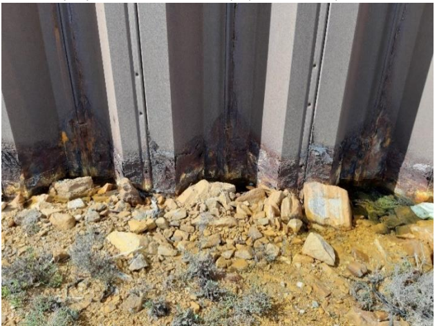
Imagen 5. Corrosión en las tablestacas de las antiguas instalaciones de Puerto Mayor (Septiembre 2022)