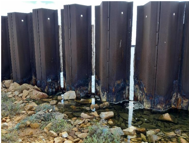
Imagen 14. Corrosión en las tablestacas de las antiguas instalaciones de Puerto Mayor (Septiembre 2022)