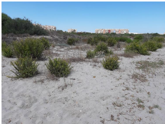
Imagen 25. Primera banda de la zona sur de la Caleta del Estacio (Septiembre 2022)