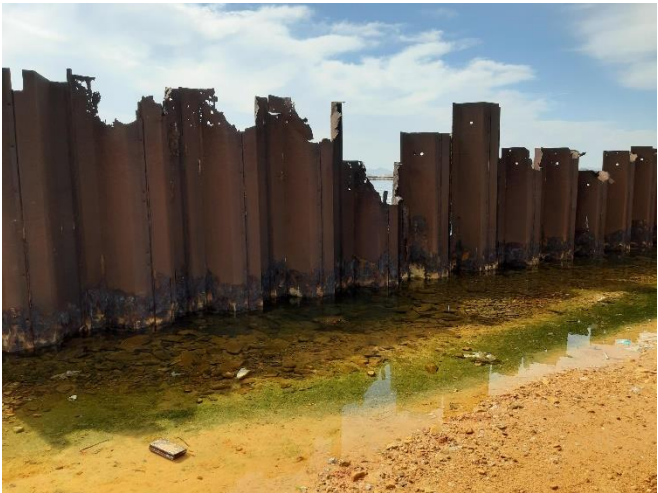
Imagen 12. Corrosión en las tablestacas de las antiguas instalaciones de Puerto Mayor (Septiembre 2022)