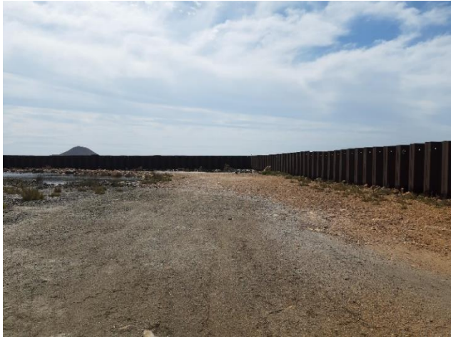
Imagen 4. Tablestacas abandonadas de las antiguas instalaciones de Puerto Mayor y materiales de relleno (Septiembre 2022)