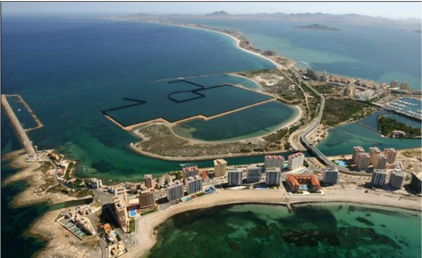
Figura 2 Vista aérea del entorno

En el presente documento se muestra un anejo fotográfico del ámbito de estudio