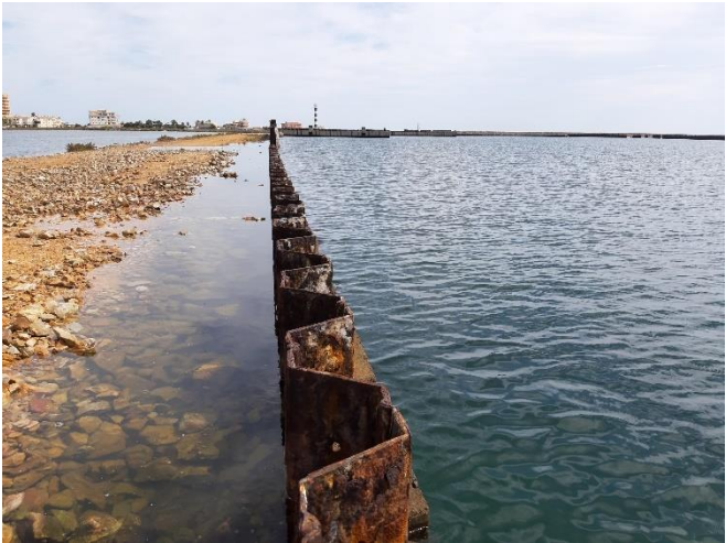
Imagen 8. Corrosión en las tablestacas de las antiguas instalaciones de Puerto Mayor (Septiembre 2022)