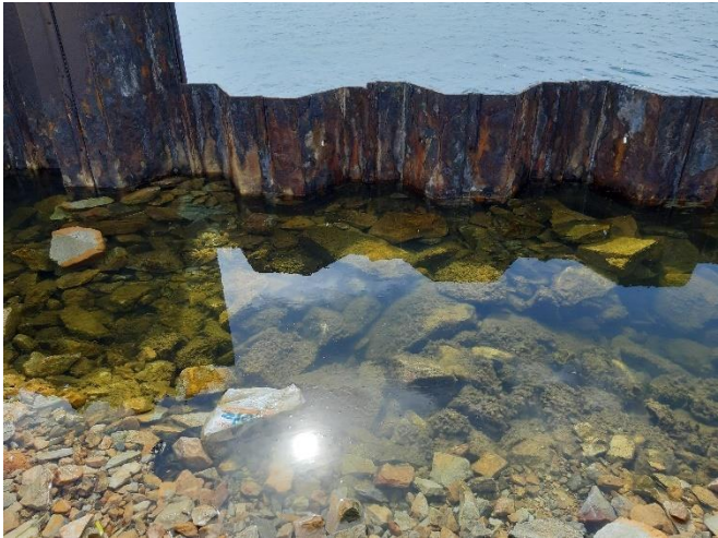
Imagen 7. Corrosión en las tablestacas de las antiguas instalaciones de Puerto Mayor (Septiembre 2022)