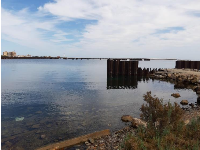
Imagen 23. Restos de tramos de tablestacas con corrosión (Septiembre 2022)