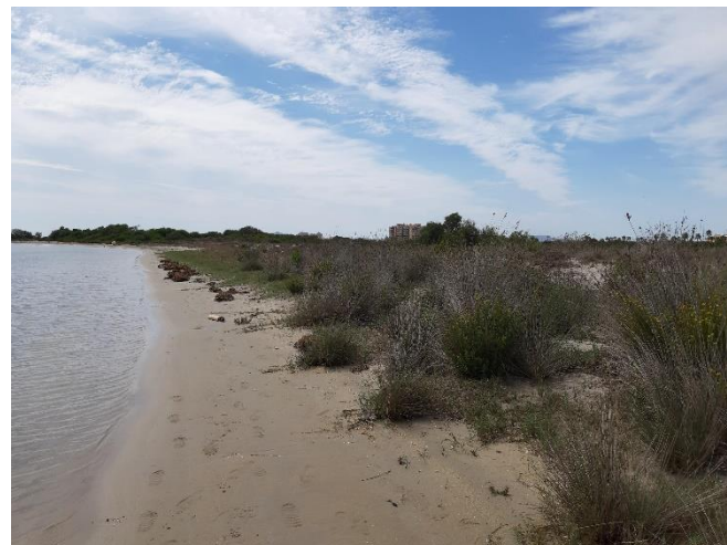
Imagen 26. Primera banda de la zona sur de la Caleta del Estacio (Septiembre 2022)