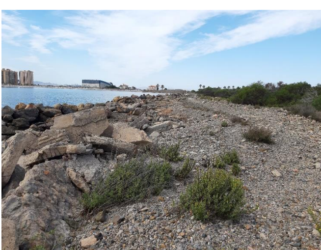
Imagen 21. Escollera en mal estado del dique sur (Septiembre 2022)