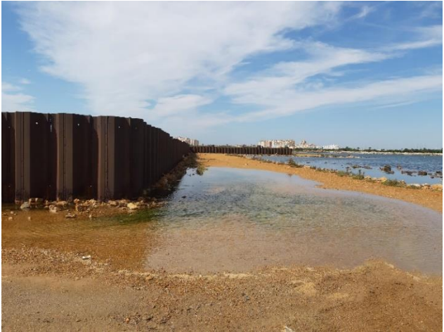
Imagen 3. Tablestacas abandonadas de las antiguas instalaciones de Puerto Mayor y materiales de relleno (Septiembre 2022)