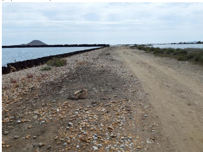
Imagen 27. Materiales de relleno junto a las tablestacas (Septiembre 2022)