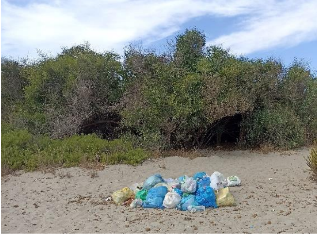
Imagen 24. Bosquetes de acacias y basuras en los arenales de la zona sur de la Caleta del Estacio (Septiembre 2022)