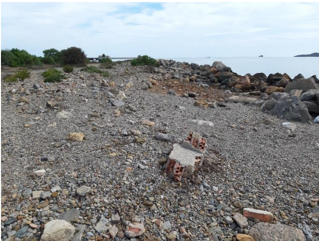
Imagen 20. Restos de materiales en el camino de acceso junto al dique sur (Septiembre 2022)