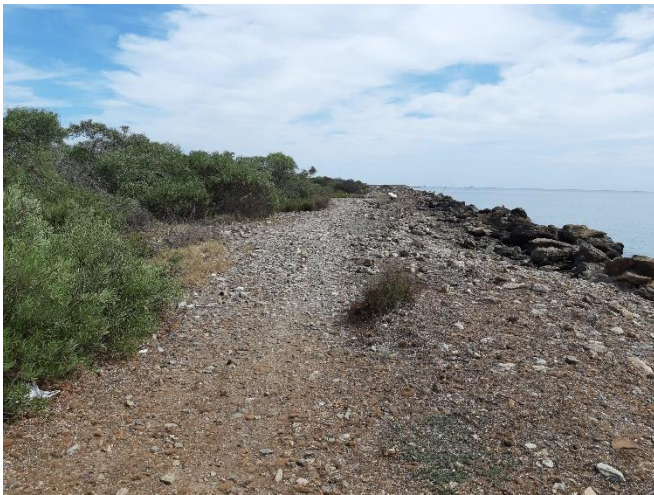
Imagen 19. Camino de acceso junto al dique sur (Septiembre 2022)