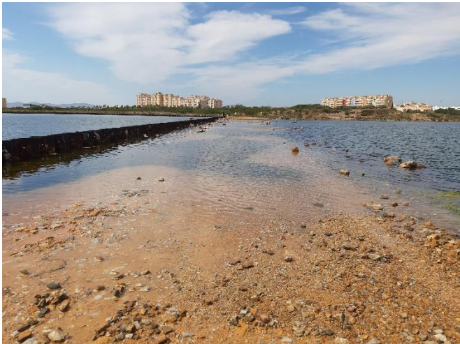
Imagen 11. Materiales de relleno en la zona de las tablestacas (septiembre 2022)