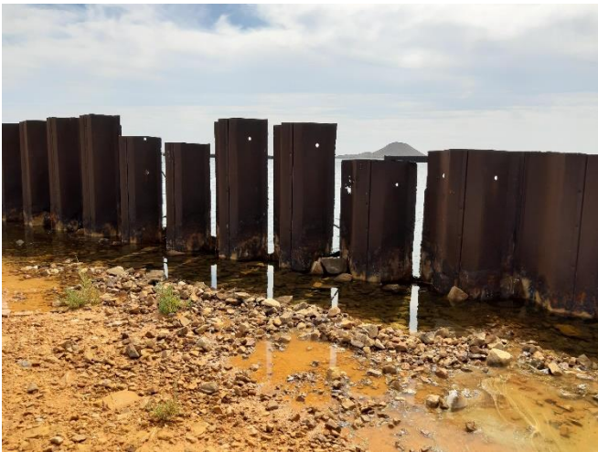
Imagen 13. Corrosión en las tablestacas de las antiguas instalaciones de Puerto Mayor (Septiembre 2022)