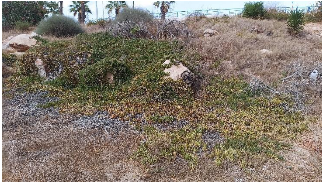
Imagen 16. Especies exóticas invasoras en un talud del perímetro de la Caleta del Estacio (Septiembre 2022)