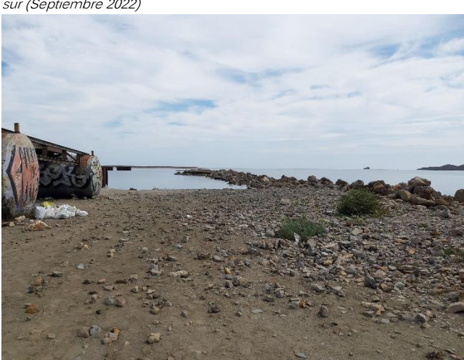
Imagen 22. Restos de materiales junto al dique Sur (Septiembre 2022)