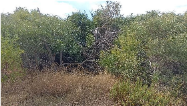
Imagen 15. Bosquetes de acacias junto a la Gola del Estacio (Septiembre 2022)