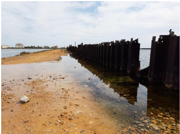
Imagen 6. Corrosión en las tablestacas de las antiguas instalaciones de Puerto Mayor (Septiembre 2022)