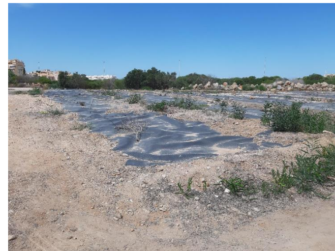
Imagen 31. Parcela experimental de ANSE para la eliminación de acacias (Septiembre 2022)