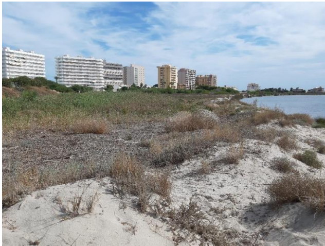
Imagen 2. Zona húmeda junto a las dunas litorales al norte de la Caleta del Estacio (Septiembre 2022)