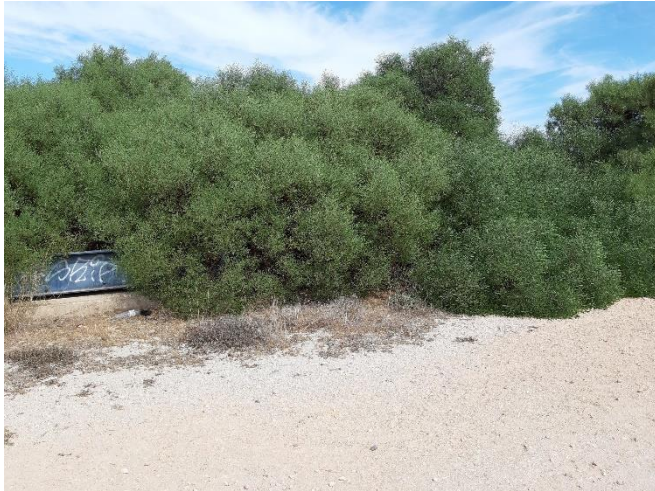
Imagen 18. Bosquetes de acacias junto al acceso Sur de la Caleta del Estacio (Septiembre 2022)