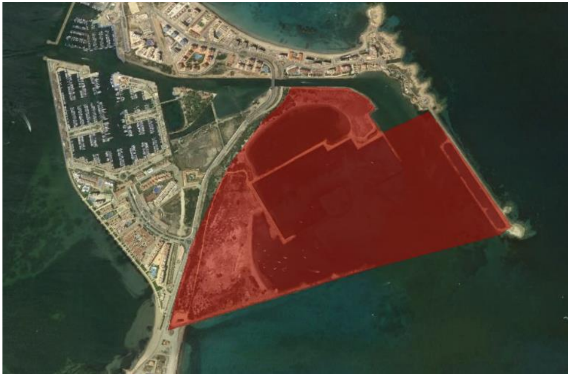
Figura 1 Ámbito de actuación

La actuación se ubica en la playa Caleta del Estacio, en la Manga del Mar Menor, T. M. de San Javier (Murcia). Este tramo de costa confronta con el deslinde de bienes de dominio público marítimo-terrestre de referencia DL-31-MU aprobado por O.M. de fecha 30/03/2000, entre los hitos DP-38 y DP-54.