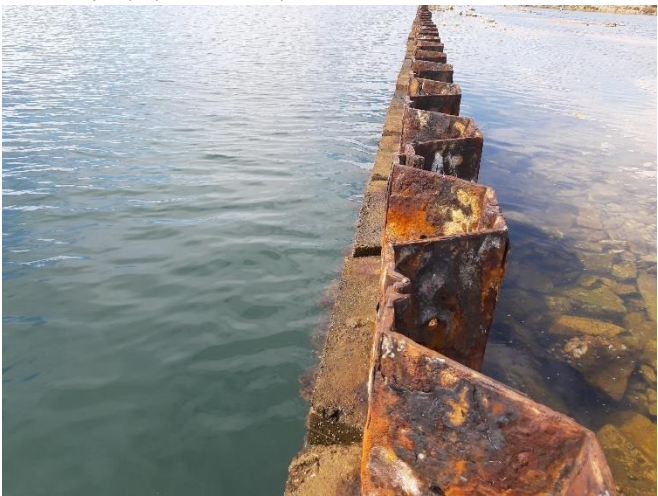
Imagen 10. Corrosión en las tablestacas de las antiguas instalaciones de Puerto Mayor (Septiembre 2022)