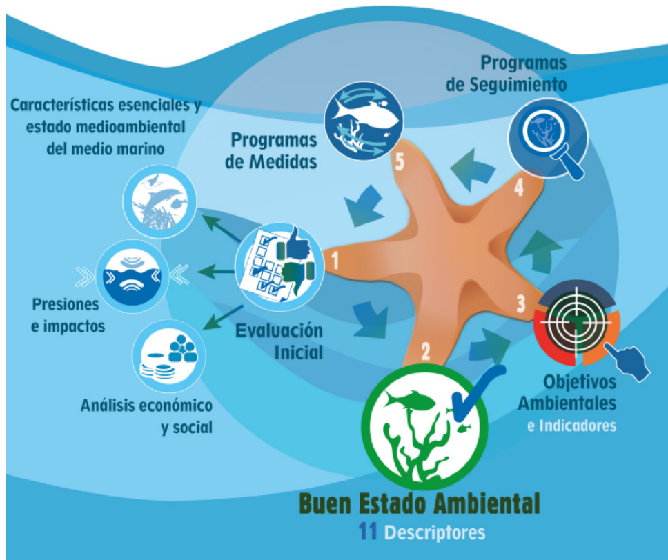
Figura 3. Fases de las estrategias marinas.