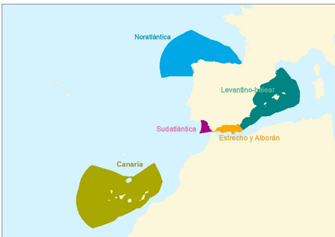
Figura 1. Demarcaciones marinas españolas.

La Ley 41/2010, de 29 de diciembre, de Protección del Medio Marino (LPMM) constituye la herramienta legal de transposición de dicha directiva en el ordenamiento jurídico español, dividiendo el medio marino en cinco demarcaciones: noratlántica, sudatlántica, Estrecho y Alborán, levantino-balear y canaria. Para cada una de estas demarcaciones se debe elaborar una estrategia marina, con un período de actualización de seis años.