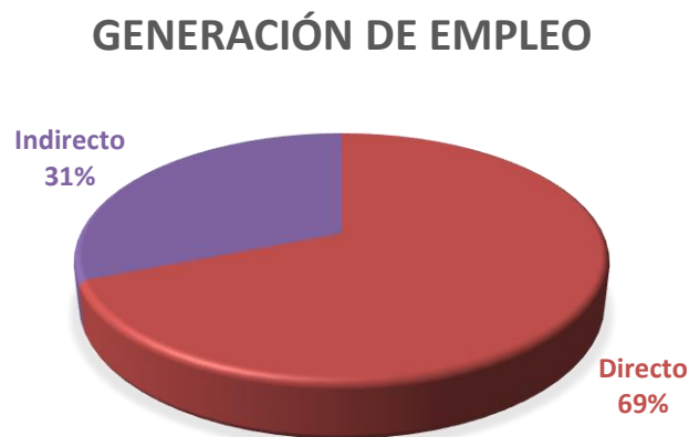
Gráfica 1: Estimación de creación de empleo directo e indirecto

En una planta de características similares, se estima una generación de empleo máxima de alrededor de 90-110 empleos directos. En cuanto a la creación de empleo indirecto, para esta estimación se ha utilizado un coeficiente de generación de empleo facilitado por el IDAE en el documento “Empleo asociado al impulso de las energías renovables” obteniendo 45-50 empleos inducidos o indirectos.