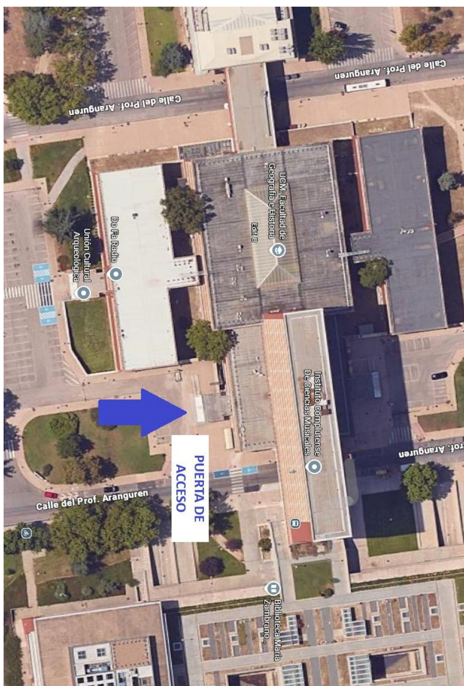
Plano de localización. Puerta de acceso a la Facultad.

Asimismo, se informa de que el acceso a la Facultad se permitirá con una antelación de treinta minutos respecto de la hora prevista para el inicio de los llamamientos, al objeto de que las personas aspirantes puedan localizar las aulas asignadas y hacer uso de los servicios disponibles en las instalaciones con carácter previo al comienzo de las pruebas.