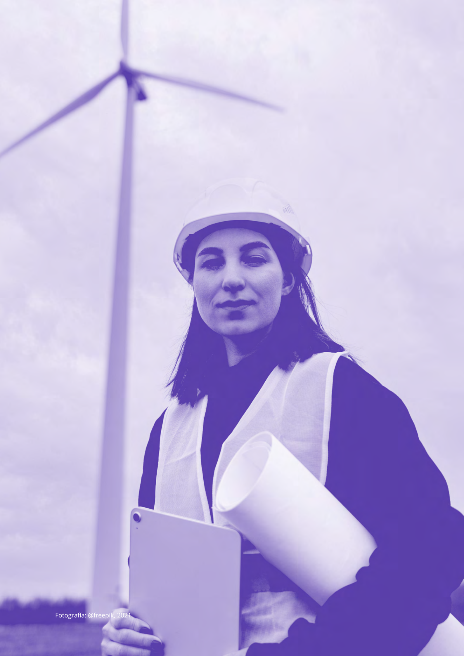
Fotografía: @freepik, 2021