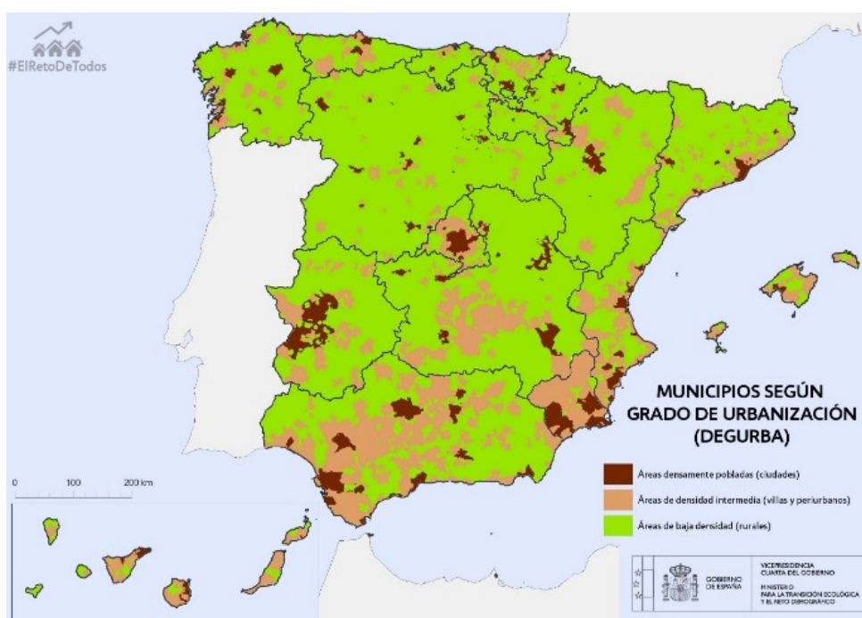
Mapa 1: Municipios según el grado de urbanización, año 2020.

Si tenemos en cuenta la variable grado de urbanización (Degurba, por sus siglas en inglés) de Eurostat, que caracteriza la intensidad del asentamiento de la población, en España las zonas rurales suponen el 73% de la superficie, y en ellas habitan más de 6 millones de personas (mapa 1). La España rural no está vacía, al menos una de cada 10 personas de nuestro país vive en nuestros pueblos.