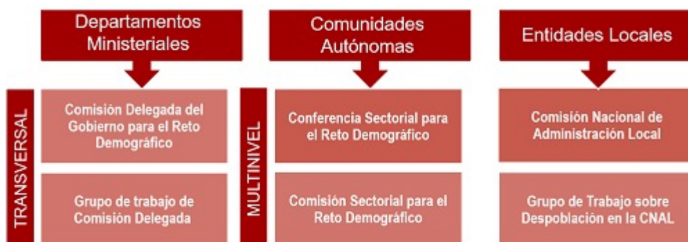
Esquema de gobernanza multinivel para la política de reto demográfico.

La Secretaría General para el Reto Demográfico se configura en un modelo de Gobernanza multinivel, con un enfoque transversal, a través de la Comisión Delegada del Gobierno para el Reto Demográfico y multisectorial, con la creación de la Conferencia Sectorial de Reto Demográfico.