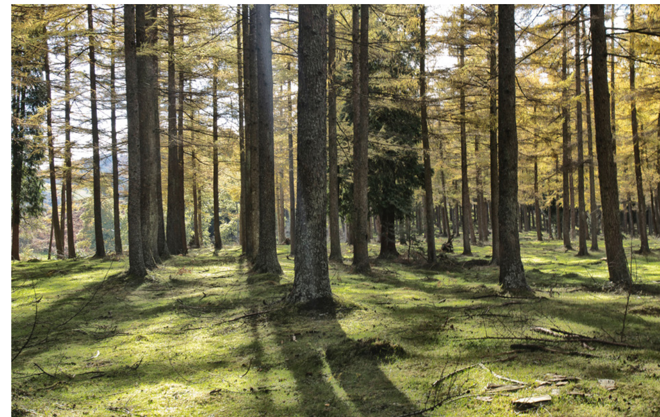
Fotografía de Guillermo Álvarez

España también participó activamente en todas las reuniones y proceso preparatorio hacia la 15ª Conferencia de las Partes del Convenio de Naciones Unidas sobre Diversidad Biológica (COP15 CDB), así como en la propia COP15, celebrada en diciembre en Montreal. En estas reuniones, la delegación española, encabezada por la vicepresidenta tercera del Gobierno, defendió junto a sus socios europeos una posición de liderazgo y alta ambición, que fue clave para la adopción del nuevo Marco mundial Kunming-Montreal sobre biodiversidad en la COP, así como de otras decisiones fundamentales para garantizar la implementación de dicho marco.