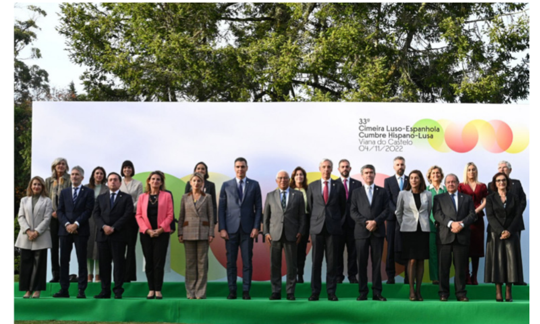
Cumbre hispano-portuguesa en Viana do Castelo nov 2022.