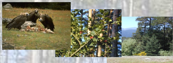
Su productividad y su capacidad de regeneración...