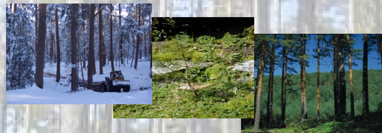
Y su potencial para cumplir funciones ecológicas, económicas y sociales... Ahora y en el futuro.