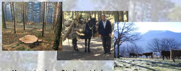
Manteniendo su Biodiversidad...