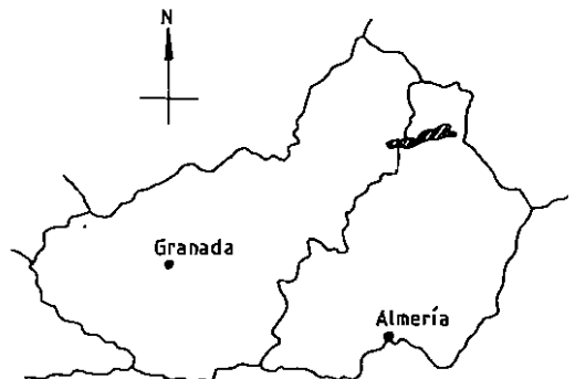
Fig. 1. Situación de la Sierra de María.

Desde el punto de vista geológico la sierra está formada por un anticlinal con núcleo de dolomías grises, correspondiendo su masa principal a calizas del Lias y calizas colíticas blancas (FA-