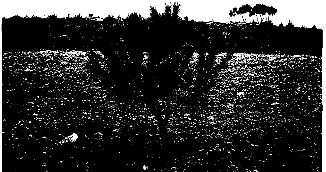
Foto 2. Injerto de pino piñonero sobre pino carrasco a los ocho años de plantación.