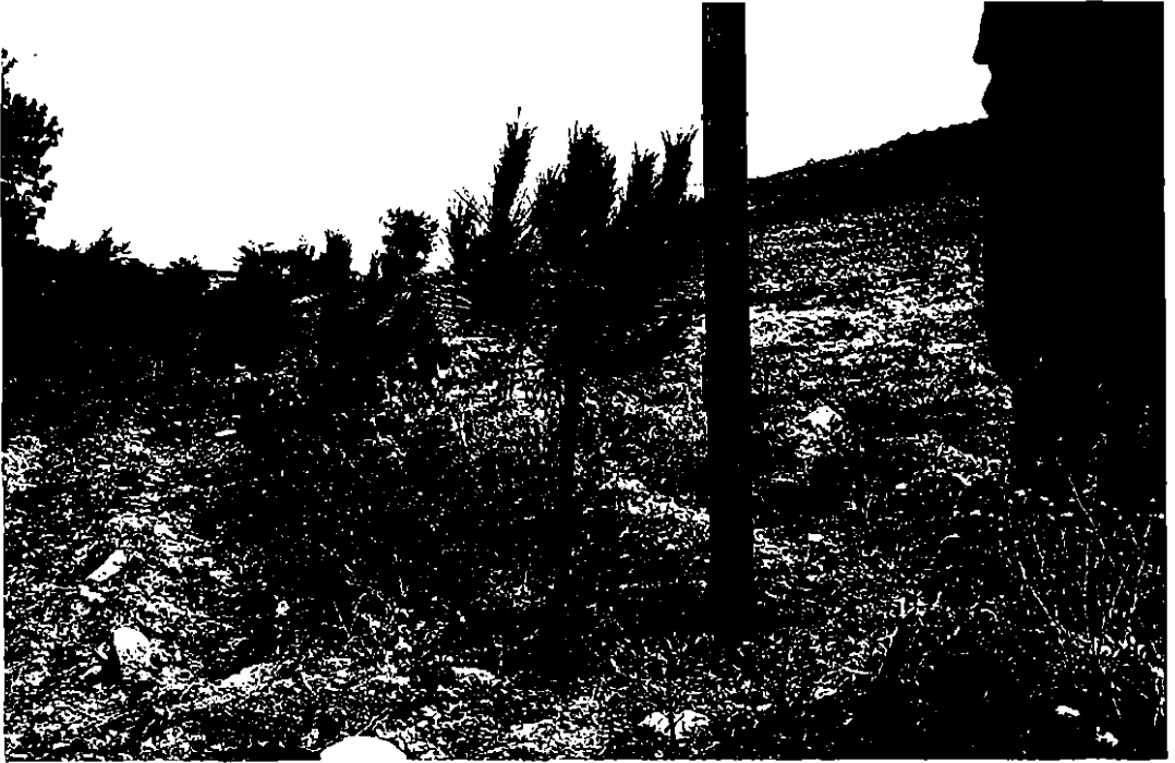
Foto 1. Injerto a los tres años y medio de haber sido plantado con una piña procedente de la floración del año siguiente a la plantación. Se aprecia la carga excesiva que supone la piña para un arbolito tan pequeño (aproximadamente 1 m de altura).