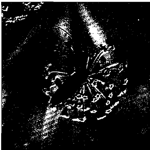
Foto 1. Adulto de Agapanthia asphodeli Latreille sobre la flor de Thapsia villosa .

Los índices más generales utilizados para valorar la efectividad de una dieta y las condiciones de cría para insectos vienen representados, fundamentalmente, por el aumento de peso de los estados inmaturos y su normal desarrollo hasta llegar a adulto.