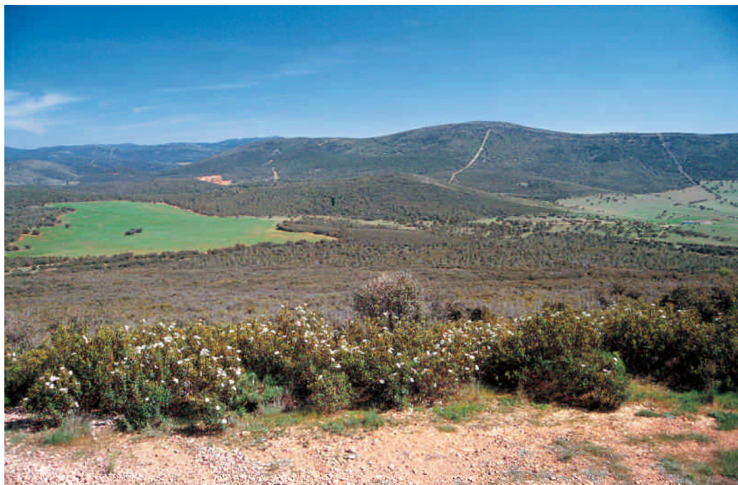
Monte mediterráneo en los Montes de Toledo Orientales (Toledo-Ciudad Real).

mediante la instalación de 182 estaciones, haciendo especial hincapié en las áreas consideradas como de alta densidad de la especie en los años ochenta (Tabla 15). No se han detectado lincees en ninguna de ellas.