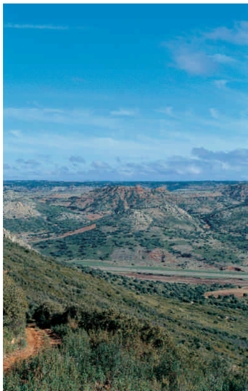
Sierras calizas con monte mediterráneo entre Albacete y la Comunidad Autónoma Valenciana.

Mapa 8) que presentaban las cuadrículas en la primera visita. Los resultados demuestran que tanto en Albacete, como en algunas zonas de Valencia se alcanzan valores elevados de conejo (41 % de las cuadrículas mantienen abundancias medias, altas o muy altas de conejo), lo que, junto a las citas de presencia de la especie recopiladas, hacían sumamente interesante el muestreo.