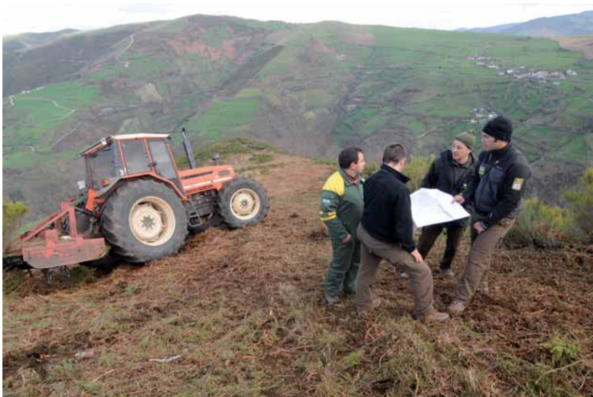
Figura 6.7. Trabajos de desbroce para creación de pastos herbáceos y, también, para la limpieza de líneas de tiro con el objeto de evitar confusiones entre osos y jabalíes durante las batidas de caza.

fosfórica, para que las plantas herbáceas compitan mejor con las leñosas (San Miguel et al. 2008). Otra alternativa interesante en pequeñas parcelas de pendiente escasa a moderada es el desbroce con gradas pesadas de desfonde y la siembra de cereal (centeno, triticale, avena) o praderas de calidad. Son tratamientos que pueden favorecer a especies como la perdiz pardilla ( Perdix perdix ), la perdiz roja ( Alectoris rufa ), la liebre de piornal ( Lepus castroviejoii ) o el urogallo ( Tetrao urogallus ), y que permiten mantener las cargas ganaderas instantáneas necesarias para retrasar o evitar el cerramiento del matorral (San Miguel et al. 2008).