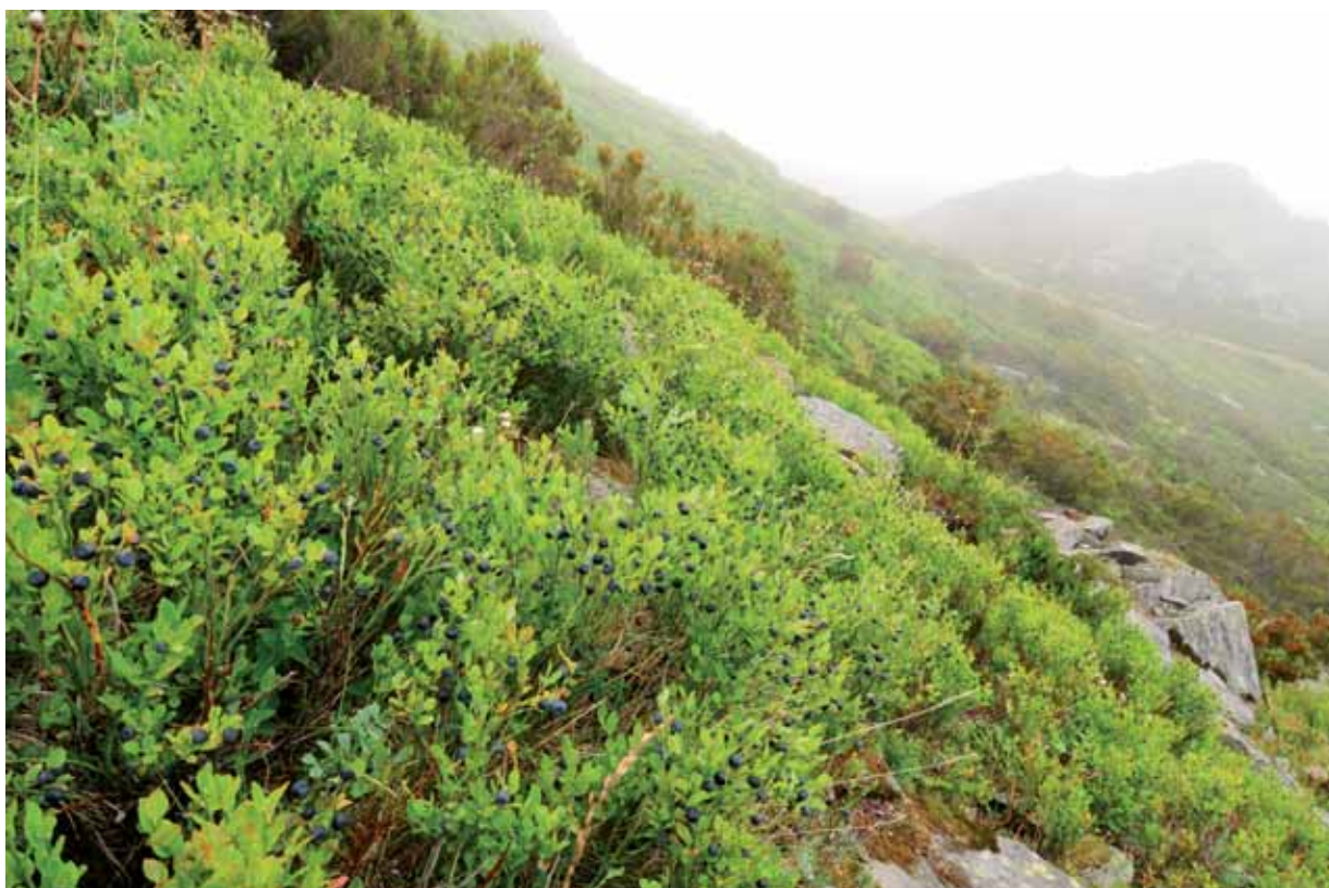
Figura 6.3. Arandanera supraforestal con una excelente producción de fruto. Alto Sil (León).

preciso tener siempre en cuenta los posibles efectos negativos de estas actuaciones y con ello valorar su ejecución.