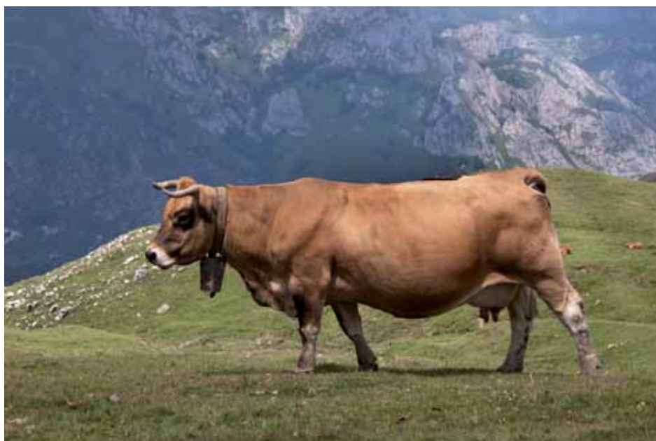
Figura 6.10. Una carga ganadera adecuada es necesaria para mantener o mejorar la calidad de los pastos. Vaca Asturiana de los Valles en los puertos de montaña del corredor interpoblacional.

Una de las principales herramientas de gestión para conseguir estos fines es fomentar, o al menos conservar, la ganadería extensiva en los pastos de los puertos cantábricos, principalmente con ganado ovino,