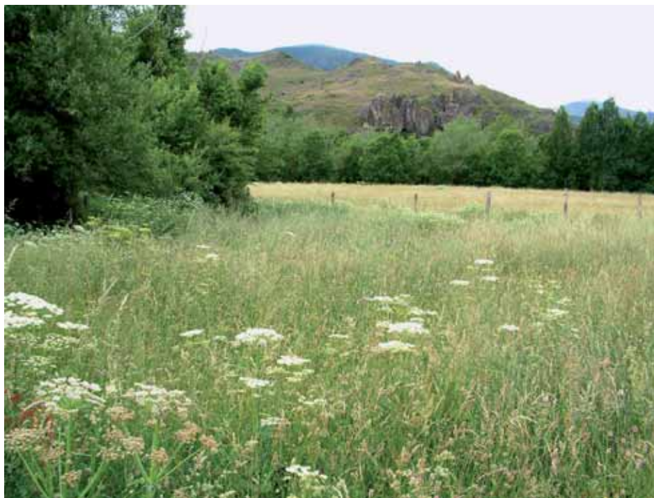
Figura 6.8. Prados de siega de Malvo-Arrhenatheretum con abundantes megaforbias, en San Emiliano (León).

A principios de primavera, los osos comen brotes tiernos de gramíneas y otras plantas herbáceas, que tienen un buen contenido en proteína y una alta digestibilidad. Por su condición de carnívoros adaptados a una dieta omnívora, los osos son poco eficientes en la asimilación de vegetales, por lo que necesitan y seleccionan materiales jóvenes y fácilmente digeribles. En esta época, los osos pastan en calveros entre piorrales, brezales y canchales, a veces en exposiciones de solana. También lo hacen en repisas, barrancos, fisuras de las rocas y cortados a veces aparentemente inaccesibles. A finales de la primavera, empiezan a comer umbelíferas de hoja ancha, propias de bordes de arroyos y prados húmedos.