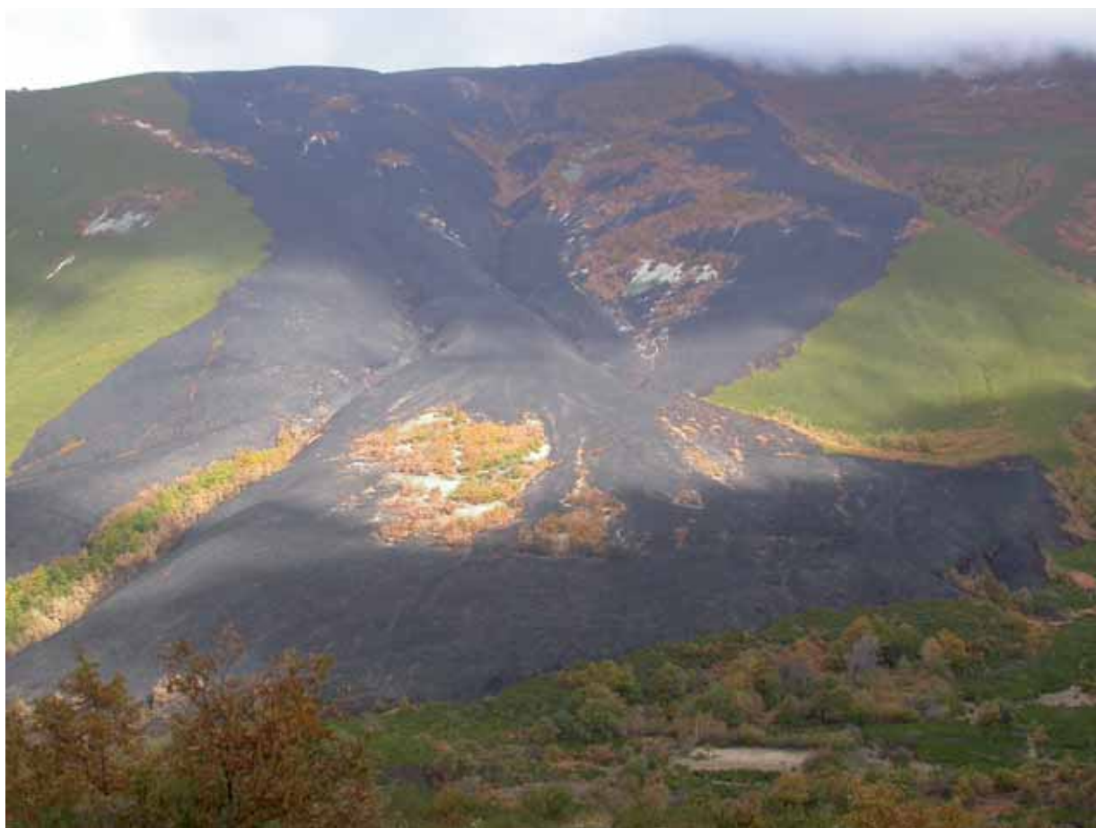
Figura 6.5. Aspecto de una ladera de brezal y bardas de rebollo, en una solana del occidente cantábrico, después de un incendio.

Estos matorrales constituyen recursos tróficos de interés estratégico para el ganado y la fauna silvestre en momentos de escasa oferta de alimento, aunque de baja calidad pastoral. También ofrecen un buen refugio para la fauna silvestre, y entre ellos el oso, cuando se presentan especies ( Erica spp.) de talla alta, y son muy valorados en la apicultura. Como ya se ha señalado, pueden además jugar un papel trascendental en el regenerado de algunas especies arbóreas, ya que, aun creándoles cierta competencia, el regenerado se beneficia de su protección frente a las inclemencias meteorológicas y especialmente frente al ramoneo, al aprovecharse de la labor facilitadora del poco palatable matorral colonizador en cuyo interior se encuentra.