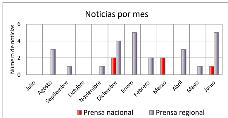
Gráfico 1: Noticias, distribuidas por meses, recogidas en los periódicos nacionales y regionales para el Parque Nacional de Garajonay. Julio 2017-Junio 2018.